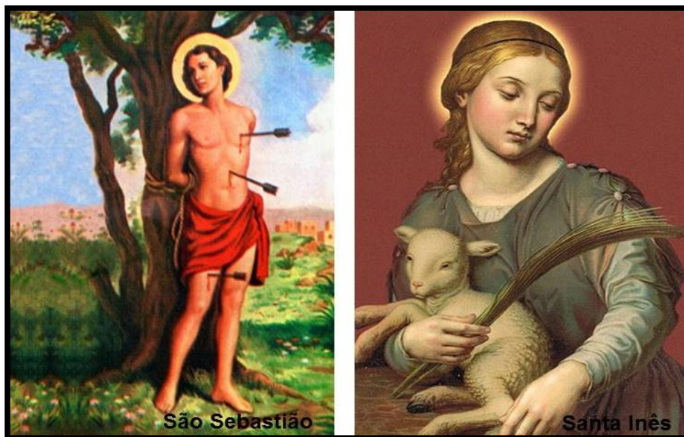
Figura 2: São Sebastião e Santa Inês, Dona Inês, 2017.

Santa Inês ( Figura 2 ) pertencia à nobreza romana, era destacada por uma beleza, e seu nome significa “pureza” em grego. Mesmo recebendo proposta de casamento aos 13 anos de idade, pelo filho do prefeito de Roma, Inês dizia que consagrara inteiramente a Deus. O seu pretendente a acusou ao Imperador Diocleciano como adepta ao cristianismo, sendo então, torturada e condenada à morte. Inês morreu degolada e foi enterrada na Via Nomentana (proximidades de Roma), onde mais tarde fez- se uma igreja em sua devoção 1 .