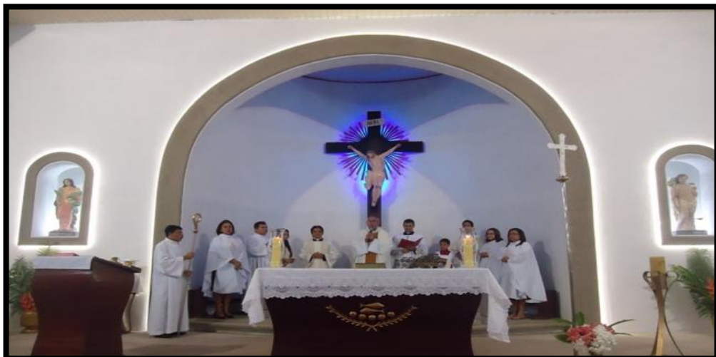
Figura 5: Igreja Matriz/ altar, Dona Inês, 2017.

A Igreja Matriz é constituída de um altar, onde se tem a estátua de Santa Inês e de São Sebastião, Padroeiros da cidade ( Figura 5 )