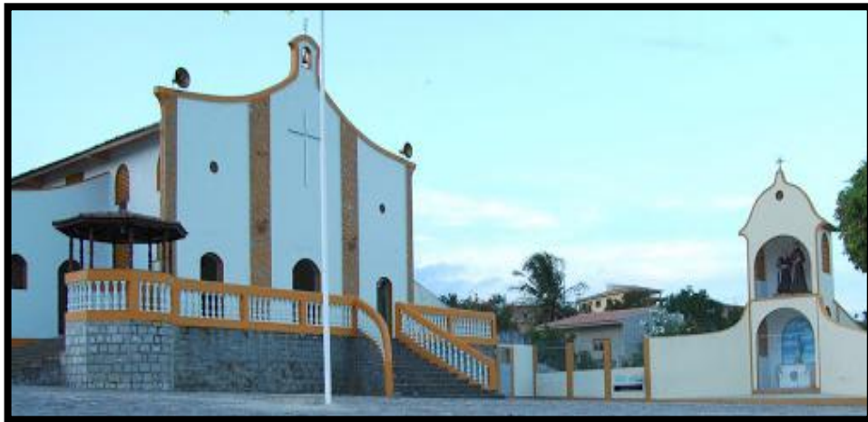
Figura 4: Igreja Matriz, Dona Inês, 2017.

igreja, a igreja Matriz ( Figura 4 ) de Nossa Senhora da Conceição, na qual foi inaugurada mesmo inacabada no ano de 1976. Por esse tempo a festa de São Sebastião já era tida como a festa do padroeiro, mesmo com o incentivo dos padres ao novenário de Nossa Senhora da Conceição, essa devoção foi sempre tida como secundária 1 .