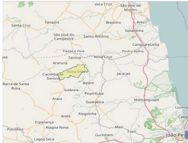
Figura 1: Localização da cidade, Dona Inês, 2017.

A cidade de Dona Inês está localizada na região do curimataú (agreste paraibano) a aproximadamente 160 km da capital João Pessoa, possuindo uma população predominantemente católica (IBGE, 2017).