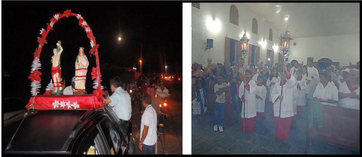
Figura 7: Carreata e missa, Dona Inês, 2017.

vindo da igreja de Nossa Senhora de Guardalupe, da comunidade de Queimadas, até a igreja matriz, onde é celebrada a missa ( Figura 7 ) e abençoado os veículos 2 .