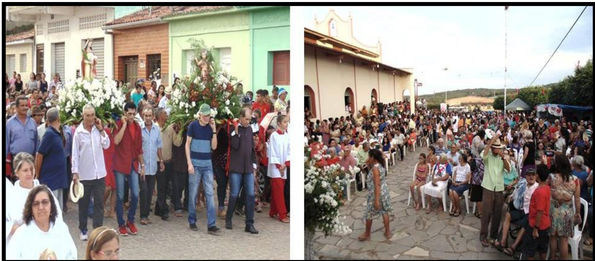
Figura 8: Procissão e missa de encerramento, Dona Inês, 2017.

Houve a preservação da finalização do novenário, que ainda continua com a procissão das imagens dos santos ( Figura 8 ), saindo da igreja mãe, percorrendo pela cidade, até retornar a referida igreja, onde é celebrada a missa ( Figura 8 ) de encerramento, hoje campal 2 .