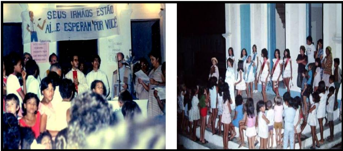
Figura 6: Celebração da missa e Ladainhas, Dona Inês, 2017.

No início o novenário de São Sebastião terminava com a celebração de uma missa ( Figura 6 ) e a procissão com a imagem do santo pela cidade. Com o passar do tempo às comunidades da zona rural começaram a participar, e depois até pessoas de outras cidades. Nesse tempo os fiéis da zona rural passaram a fazer doações (animais, frutas e sementes) para serem leiloados na festa da igreja. O novenário se tornou um grande evento religioso e posteriormente passou a integrar uma festa de rua (profano), em frente à igreja logo após a missa. Nessa festa de rua, era armado um pavilhão para diversão popular, sendo o lucro revertido à igreja para reformas e aquisição de objetos religiosos. Depois de um tempo essas festas de ruas foram abandonadas, ficando o novenário, com missas e leilões 1 . Existiam também as ladainhas ( Figura 6 ), cantadas por grupos da fita azul e vermelha 2 .