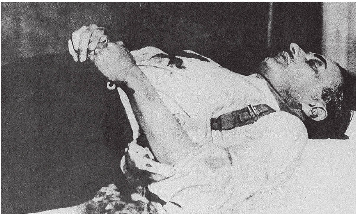
Corpo de João Pessoa.