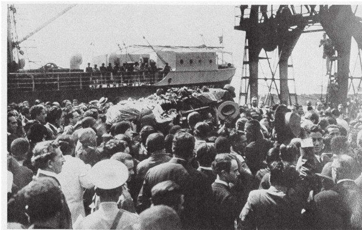
Funeral de João Pessoa (RJ).

Ao transformar João Pessoa num messias, Os Liberais transformavam os seus adversários em inimigos da Pátria, Judas que deviam serem destruídos e apagados da memória do povo.