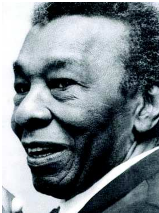
Figura 04: As marcas da passagem do tempo na fisionomia de Milton Santos.