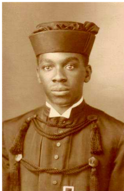
Figura 01: A imagem do per odo de transi o acad mica de Milton Santos.