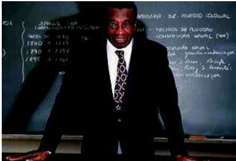
Figura 02: Milton Santos em um dos seus momentos em sala de aula.