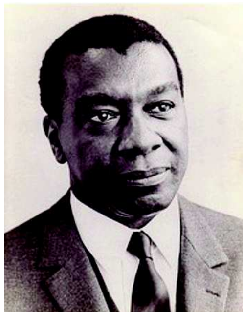
Figura 03: A imagem do geógrafo negro.