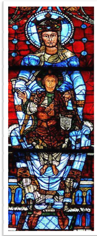
Figura 7 Vitral da catedral de Notre-Dame, estilo Habacuc 9

Todavia, na composição de um mestre, o labirinto das peças de chumbo conseguia transforma-se em figuras de uma monumentalidade imponente, como é o caso da Habacuc 8 :