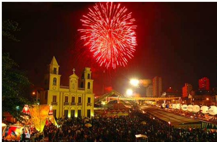
Cachoeira do Roncador em Borborema