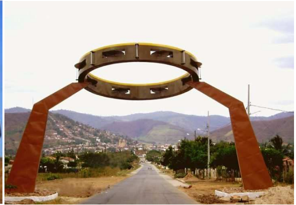
Alagoa Grande: de Jackson do Pandeiro