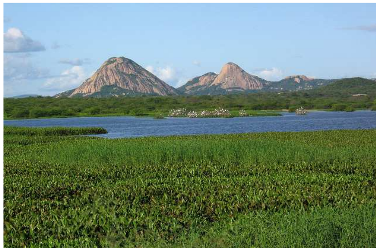
IMAGEM DO SERTÃO PARAÍBANO