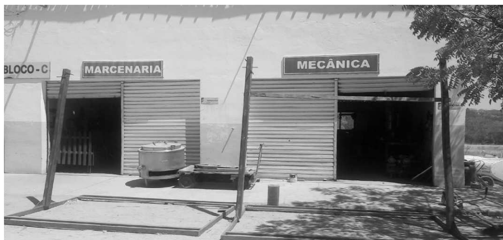
Figura 2 – Oficina mecânica e marcenaria da EAC, Campus-IV (UEPB) Catolé do Rocha – PB, 2017.

No Campus IV possui uma marcenaria (Figura 2), que é utilizada apenas para serviços internos, visando melhorar a decoração do ambiente tanto da escola como da graduação; dispõe de uma oficina mecânica que é utilizada para o concerto e manutenção dos equipamentos que são utilizados no campo, como o ônibus, o trator, as grades que são utilizadas para preparar o solo nos projetos, e em outros equipamentos que venham a carecer de algum suporte.