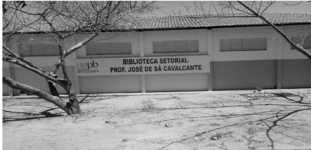
Figura 1 - Biblioteca. EAC, CAMPUS IV Catolé do Rocha-PB, 2017.

pesquisa no campo, que são: olericultura, fruticultura, viveiricultura, suinocultura, bovinocultura, Caprinovinocultura, fitotecnia e estufas, onde os alunos de ambos os cursos podem desempenhar pesquisas a fim de enriquecer seu conhecimento e currículo.