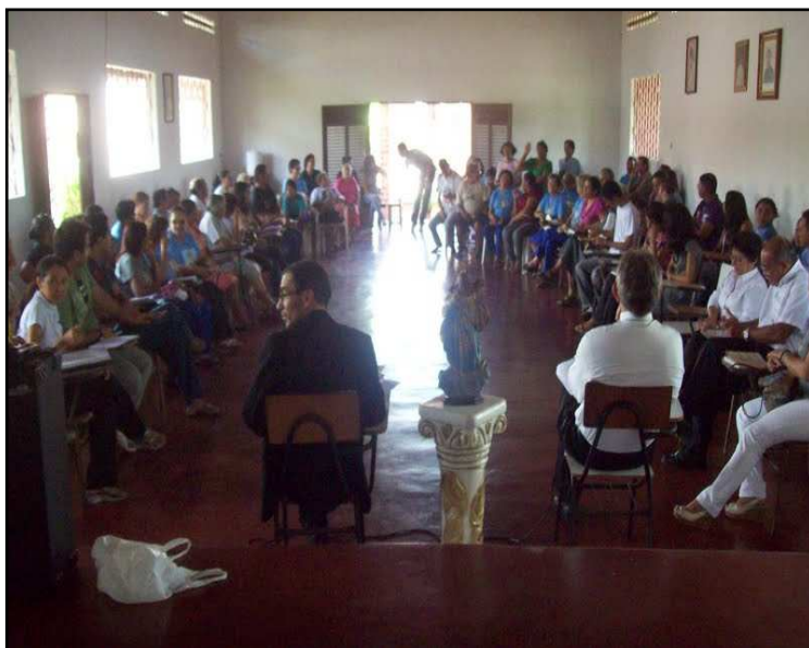
Foto 12: Os Animadores atentos à palestra.