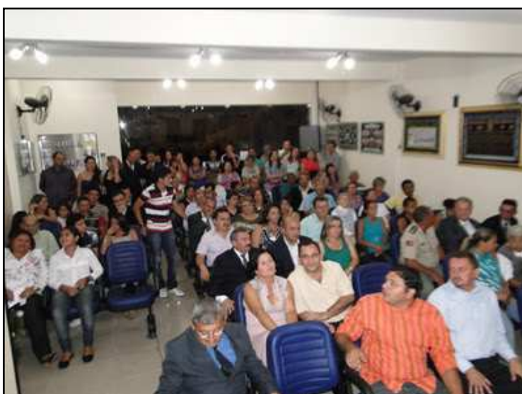
Foto 09: População reunida na Câmara Municipal.