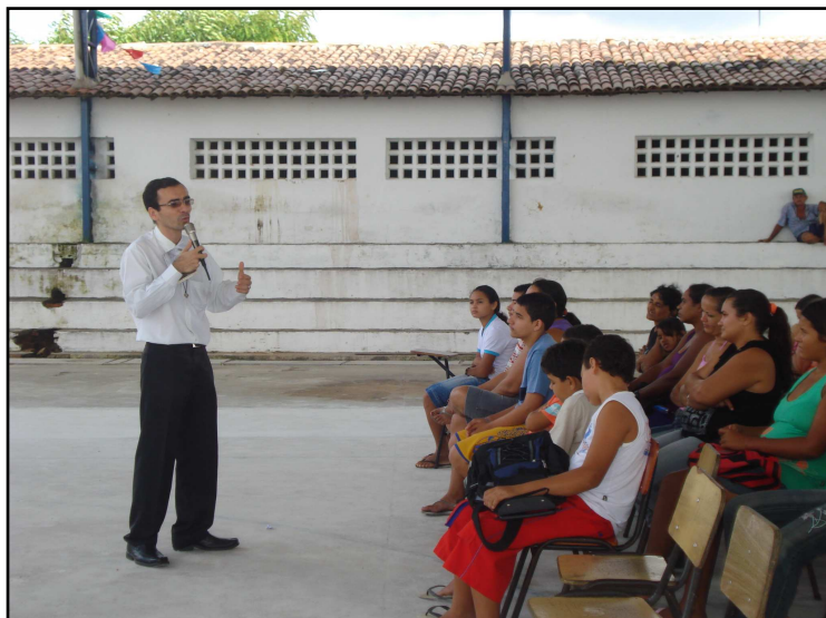
Foto 13: Palestras nas escolas sobre a CF 2011