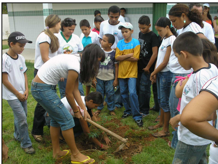
Foto 16: Os Alunos plantando algumas mudas na escola.