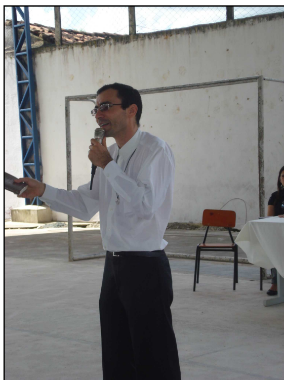
Foto 14: Palestras nas escolas sobre a CF 2011

Com o aprofundamento deste assunto, foi possível analisar os problemas urbanos/ambientais, inerentes na cidade de Pírpirtuba/PB, fortalecendo a conscientização ambiental pautada na relação Escola/ Sociedade/ Igreja.