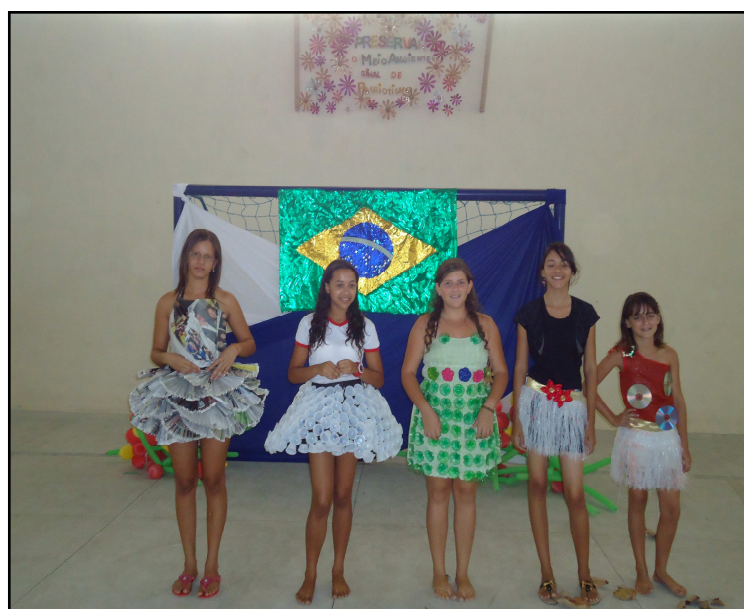
Foto 19: Desfile com roupas feitas de material reciclável.