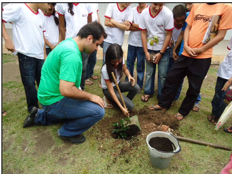
Foto 15: Os Alunos plantando algumas mudas nas ruas.

A culminância dessa pesquisa aconteceu no dia 21 de Setembro de 2011, em decorrência do Dia da Árvore, onde aconteceram as seguintes ações: Plantio de mudas com a participação dos alunos, dos professores, da Direção e da comunidade local. Tivemos também a exibição de slides com o tema (Todos em Defesa do Planeta), a composição de poesias e paródias, apresentação de danças com o tema (O verde é nosso), desfile de roupas com o tema reciclagem, exposição de cartazes e exposição de plantas medicinais.