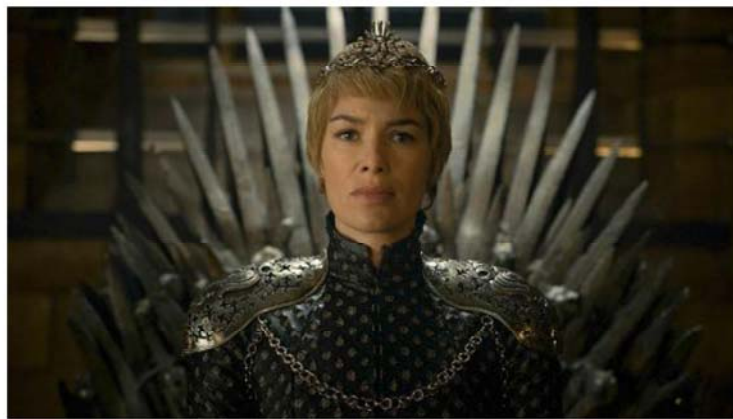
Imagem 03. Cena da 10º episódio na 6ª temporada de "Game of Thrones" Cersei Lannister recebendo a coroa de rainha dos Sete Reinos

Com a ajuda de Qyburn, ela mata em uma explosão o Alto Pardal, Margaery, Loras e todo o Pequeno Conselho, além dos soldados da Fé. Ao ver a explosão, Tommen comete suicídio, saltando do alto castelo. Então, a casa Baratheon fica oficialmente extinta, e como resultado, Cersei é oficialmente coroada como Rainha dos Sete Reinos.