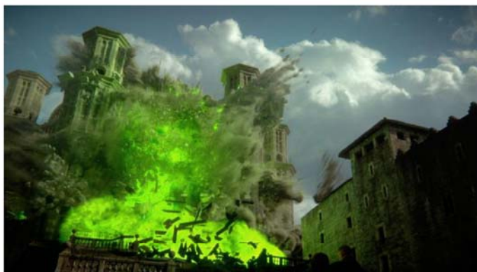
Imagem 05. Cena do 10º episódio na 6ª temporada de “Game of Thrones” Explosão do grande Septo de baelor.

No dia de seu julgamento pelos deuses mediado por Alto Parda, ela conseguiu enganar todos ao armar uma cilada para os Pardais. Utilizando o fogo vivo, Cersei, armou uma emboscada para os inimigos que estavam esperando por seu julgamento, incluindo Margaery e Loras, e explodiu a todos, assim, ninguém sobreviveu ao ataque.