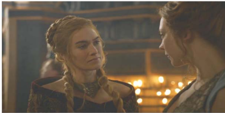
Imagem 02. Cena do 8º episódio na 3ª temporada de “Game of Thrones” Cersei Lannister dialogando com Margaery Tyrell

Cersei: Nunca mais me chame de irmã ou mandarei estrangulá-la enquanto dorme. (GAME OF THRONES -3ª temporada. 8º episódio).