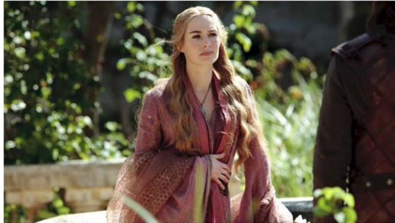
Imagem 01. Cena do 7º episódio na 1ª temporada de “Game of Thrones” Cersei Lannister dialogando com Ned Stark

Cersei: Foi sim. Ao jogar o jogo dos tronos, você ganha ou morre. Não há meio-termo. (GAME OF THRONES -1ª temporada. 7º episódio).