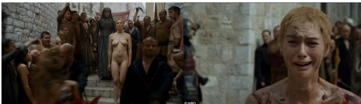
Imagem 04. Cena do 10º episódio na 5ª temporada de “Game of Thrones” caminhada da expiação de Cersei Lannister.