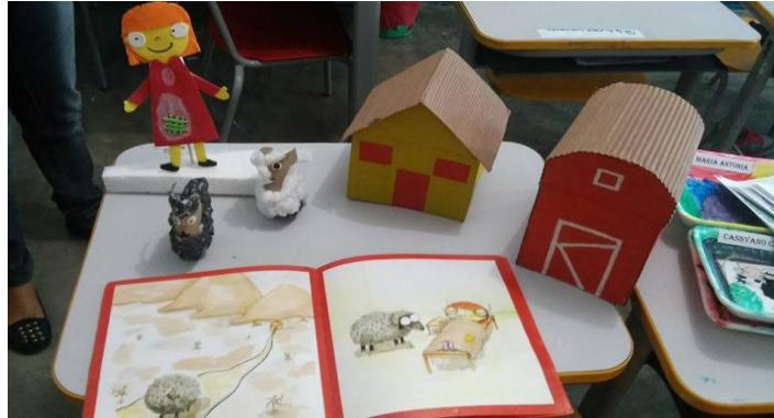
Figura 3: Leitura e produção dos personagens reciclando papeis

realidade socioambiental de um modo comprometido com a vida, com o bem-estar de cada um e da sociedade. Para isso, é importante que, mais do que informações e conceitos, a escola se disponha a trabalhar com atitudes, com formação de valores e com mais ações práticas do que teóricas para que o aluno possa aprender a amar, respeitar e praticar ações voltadas à conservação ambiental.