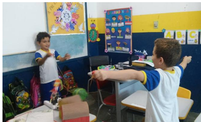
Figura 2: Jogo do vai e vem produção com as crianças com garrafa pet nas series iniciais.

Observa-se na figura 1 produção do jogo com garrafa pet ,onde foi desenvolvido com uma oficina na escola com as crianças ,compreendendo a importância de reutilizar garrafas e ao mesmo tempo desenvolver atitudes ambientais na escola. As questões ambientais estão cada vez mais presentes no cotidiano da sociedade, contudo, a educação ambiental é essencial em todos os níveis dos processos educativos e em especial nos anos iniciais da escolarização, já que é mais fácil conscientizar as crianças sobre as questões ambientais do que os adultos