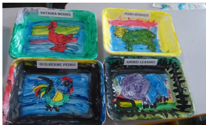
Figura 4: Reutilizando pratinhos de alimentos para confeccionar quadrinhos

As crianças reutilizaram pratinhos descartáveis e produziram esses quadrinhos como resultados de leituras anteriores em sala de histórias infantis como verifica-se na figura 4.