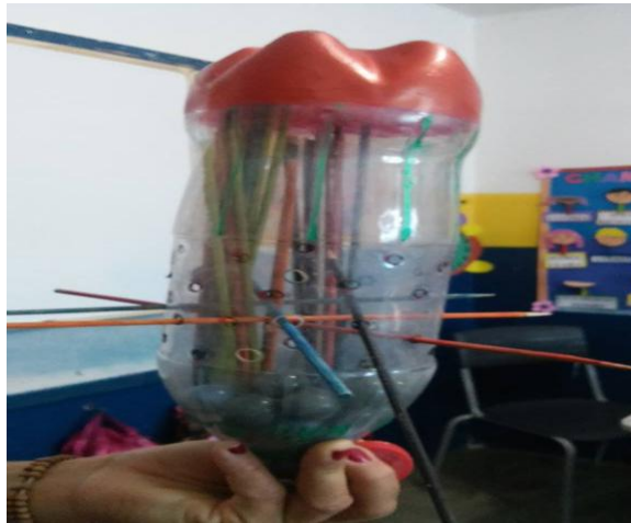
Figura 1: Jogos com garrafa pet

Observa-se na figura 1 produção do jogo com garrafa pet ,onde foi desenvolvido com uma oficina na escola com as crianças ,compreendendo a importância de reutilizar garrafas e ao mesmo tempo desenvolver atitudes ambientais na escola. As questões ambientais estão cada vez mais presentes no cotidiano da sociedade, contudo, a educação ambiental é essencial em todos os níveis dos processos educativos e em especial nos anos iniciais da escolarização, já que é mais fácil conscientizar as crianças sobre as questões ambientais do que os adultos