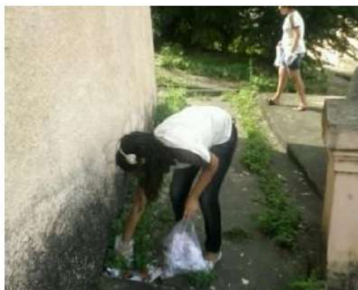
Figura 2: Coleta de lixo feita por estudantes do 5º da EEEF Antenor Navarro. Data: 23/09/2014. Por: Thays Dantas.