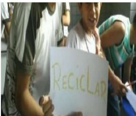
Figura 1: Apresentação de cartaz produzido na oficina de trabalho com materiais recicláveis sobre reciclagem. 5º ano da EEEF Antenor Navarro. Data: 28/08/2014. Por: Thays Dantas