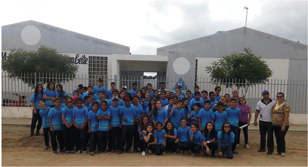
Figura 01 – Visão externa com os alunos do estágio