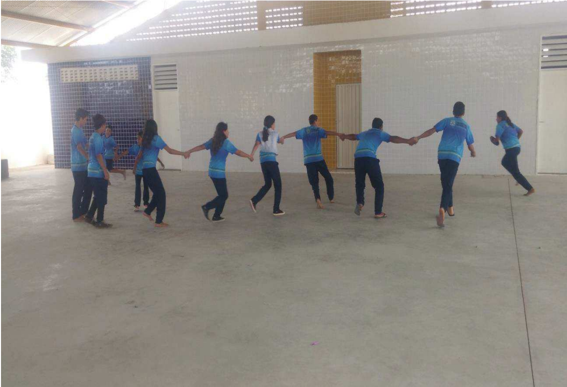
Figura 05: Aquecimento