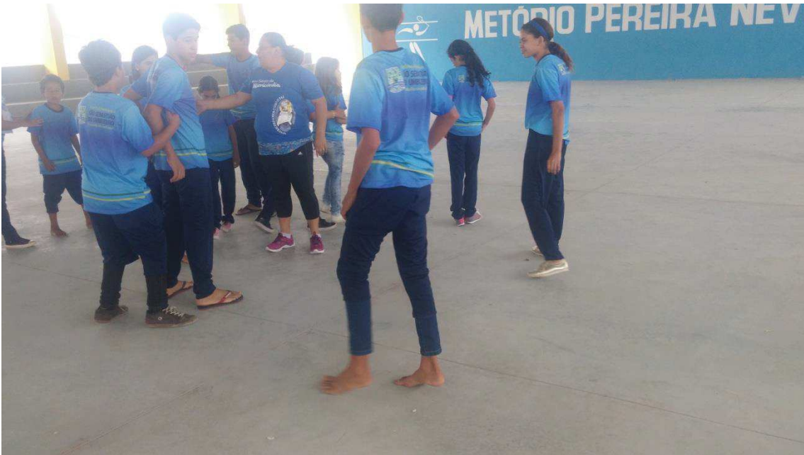
Figura 06: As orientações a serem seguidas