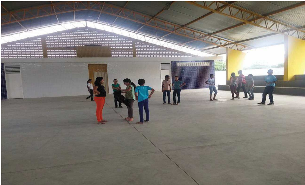
Figura 04 - Visão interna do ginásio