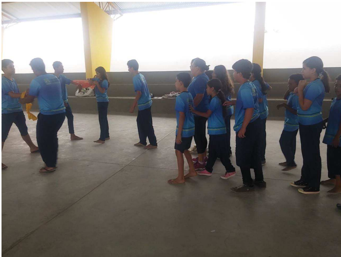
Figura 03: Último dia de aula no ginásio