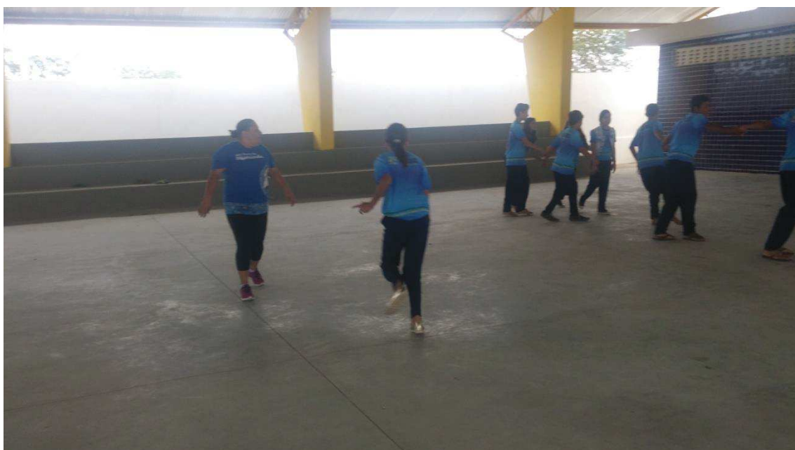
Figura 04: Atividade sob o olhar atento da Professora