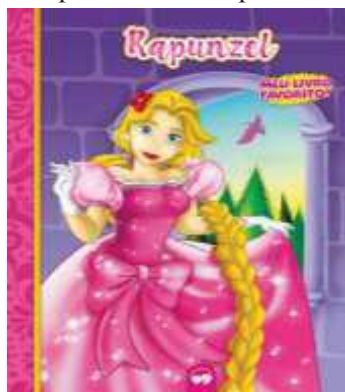
Figura 2: Capa do livro “Rapunzel”

Após o lanche voltaram para sala, sentamos novamente na cadeira, a professora continuou a história dos três Porquinhos, e entregou uma folha com o porquinho da casa de palha para que cada criança pudesse usar lápis de cor e cola e palha.