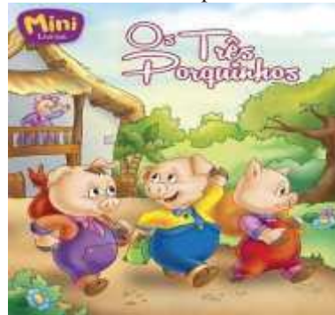
Figura -1: Capa do livro “Os Três Porquinhos”

Fonte: Extraído do livro os três porquinhos (de Cristina Marques)