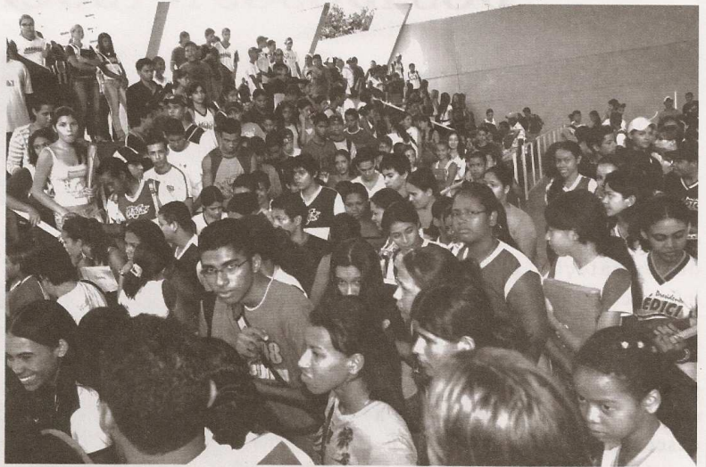
"A Juventude quer mais ser estimulada do que instruída" (Goethe)