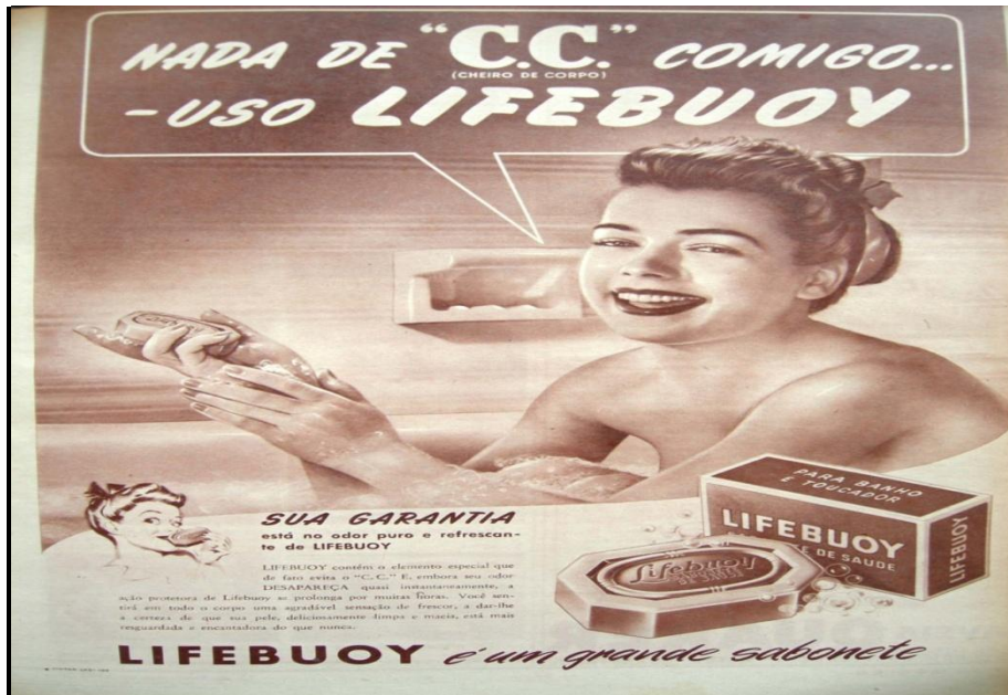
Figura 1 Anúncio do sabonete Lifebuoy. O Cruzeiro , 15/02/1947, n. 17, p. 33.