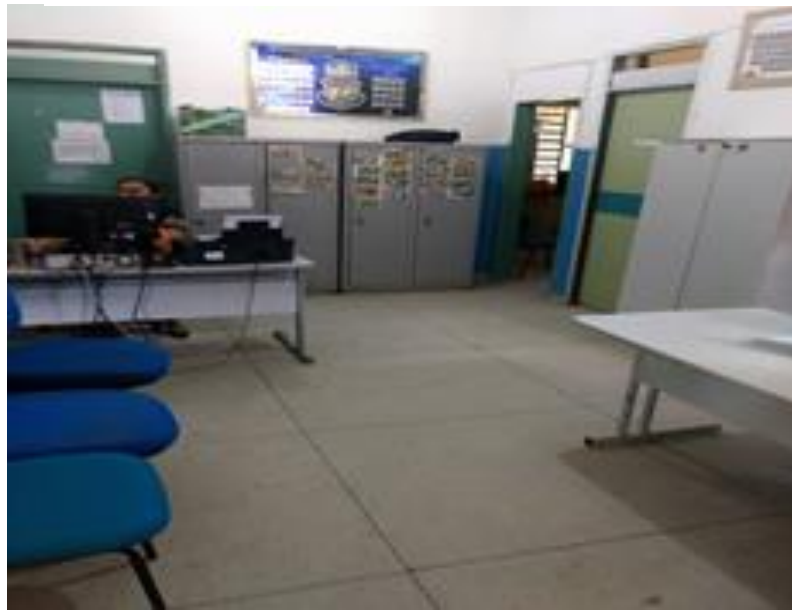
Figura 9 secretaria / direção

Nela contém 02(duas) mesas e 03(três) armários os quais são destinados para guarda os materiais e para uso de professores e secretários.