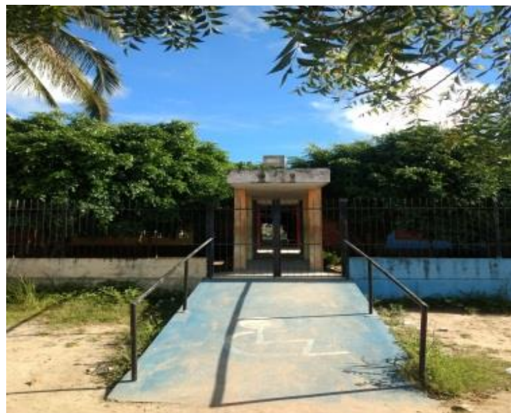
Figura 2 Vista frontal da ECI Francisco Pessoa de Brito.

A fachada da escola foi recém reformada para melhor atender as necessidades dos alunos com a construção de uma rampa para os cadeirantes possa ter um maior acesso a escola. A ECI. Francisco Pessoa de Brito encontra-se situada na Avenida Olívio Maroja S/N no bairro São Sebastião na cidade de Araçagi-PB, encontra-se na Região do Nordeste brasileiro mais precisamente no estado da Paraíba.