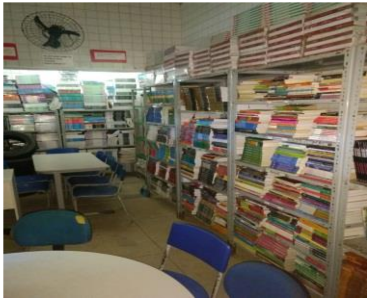
Figura 3 Biblioteca da Escola.

Conta com 1(uma) biblioteca com cerca de mais de 500(quinhetos) livros onde os alunos podem usufruir de grandes autores da geografia e também onde podem ficar mais a vontade para ler pois é um ambiente calmo onde só é permitido o acesso dos alunos se realmente for para estudar.