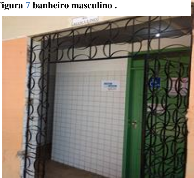
Figura 7 banheiro masculino .

Encontra-se em péssimo estado de conservação com muito lixo no ambiente e miquitorios totalmente destruídos tendo um mal cheiro muito forte no local, pois os meninos que o usam não contribue com a limpeza.