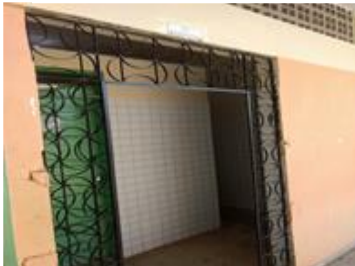
Figura 6 banheiro feminino .

O banheiro feminino está em um bom estado de funcionamento encontrando-se muito limpo com vasos e ambiente devidamente higienizado e organizado pois as próprias meninas que fazem uso do banheiro ajudam na limpeza.