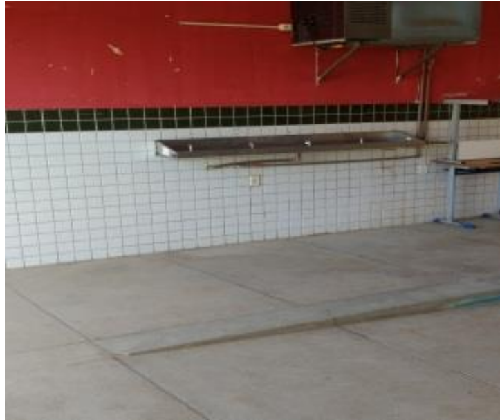
Figura 5 bebedouro da escola.

O bebedouro da escola encontra-se em perfeito estado de funcionamento tendo uma boa pressão de água não precisando encostar a boca nele para poder beber água onde fica localizado