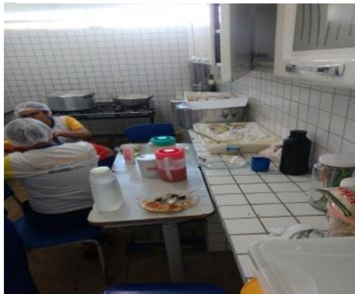
Figura 8 cozinha da escola.

Na cozinha podemos encontrar uma dispensa onde ficam armazenados todos os alimentos que serão utilizados durante a semana encontrando-se em perfeito estado de preservação.