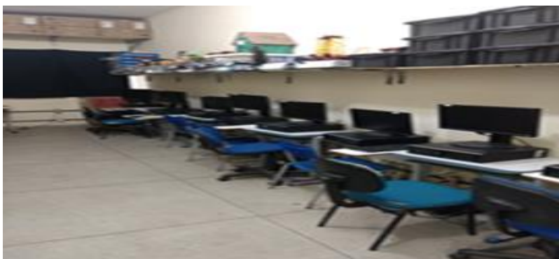
Figura 4 sala de informática da escola.

Está contida na mesma uma sala de informática que possui 11(onze) computadores em bom estado de funcionamento para assim atender as necessidades dos alunos, principalmente aqueles que não dispõem de uma boa condição financeira para possuir um computador em sua residência muito menos ter acesso à internet.