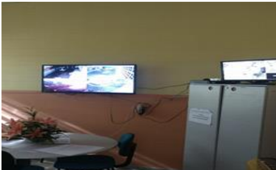
Figura 10 sistema de câmeras de segurança da escola.

A escola conta com um sistema inovador de câmeras de segurança onde pode se verificar qualquer ação suspeita podendo evitar frustrações futuras e tornando o ambiente escolar mais seguro.