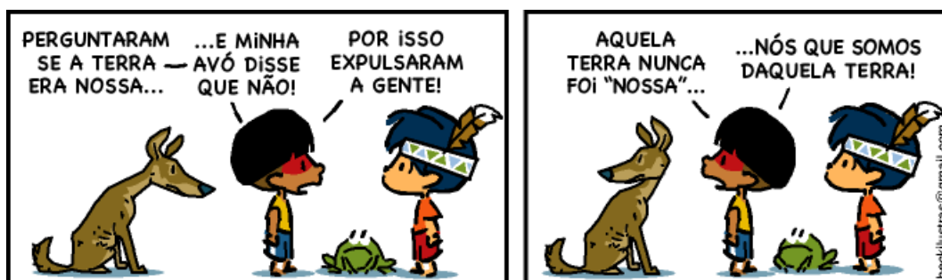
Figura 5: Tirinha do Armandinho

Um exemplo definido para o uso de uma HQs em uma disciplina que difere da Língua Portuguesa está no quadrinho a seguir, vejamos: