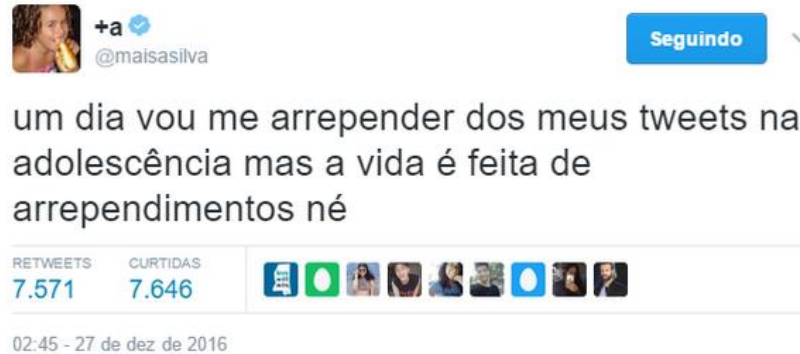
Figura 1: Tweet da Maisa Silva

apresentar linguagem coloquial e não exigir acentuação apropriada ou aspectos gramaticais da norma padrão. Vejamos no exemplo abaixo: