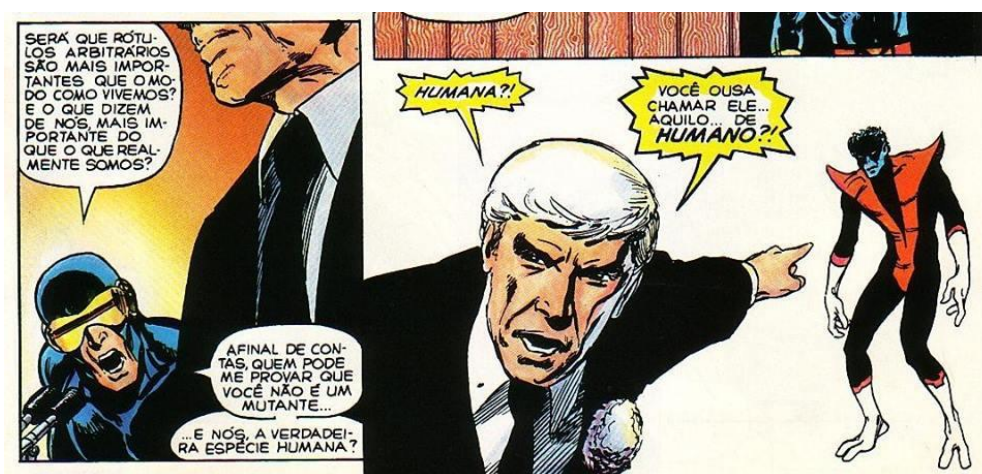
Figura 4: Quadrinho dos X-men

Após termos discutido sobre o professor ter conhecimento do gênero antes de fazer uso dele, apresentaremos três propostas de intervenções utilizando histórias em quadrinhos como recurso metodológico. As propostas não evidenciarão uma série específica a ser aplicada, pois, apresentam temáticas que podem ser trabalhadas em qualquer faixa etária. Para tanto, vejamos a tira a seguir, retirada de uma das HQs dos X-Men: