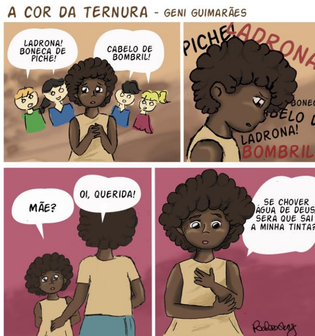
Figura 6: Quadrinho “A cor da ternura”.

O quadrinho acima é baseado na obra literária “A cor da ternura” de Geni Guimarães, publicada em 1989. O livro aborda a temática do preconceito racial que a personagem protagonista Geni sofre durante toda sua vida. A escola é o primeiro espaço em que o racismo tem um impacto realmente chocante para a personagem, o trabalho com uma obra como essa, em sala de aula, tende a ser algo enriquecedor, por apresentar problemas sociais que ainda hoje habitam o ambiente escolar, como o bullying, o racismo e a discriminação.