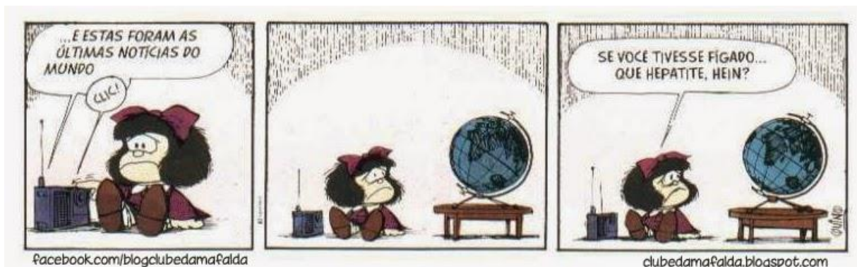
Figura 3: Tirinha da Mafalda

As histórias em quadrinhos apresentam a junção de texto e imagem para narrar uma história sequencial, apresentada quadro a quadro com as falas dos personagens inseridas em balões. Para nossa pesquisa, também vale salientar outros gêneros que possuem uma estrutura similar às narrativas das histórias em quadrinhos. Para iniciarmos a discussão, tomemos a tirinha da Mafalda como exemplo de análise: