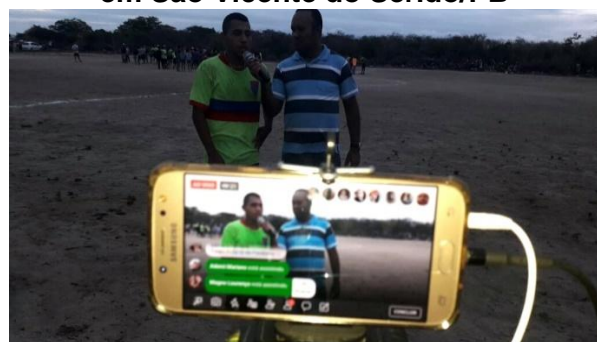
Figura 2: Dispositivos móveis sendo utilizados nas transmissões esportivas em São Vicente do Seridó/PB