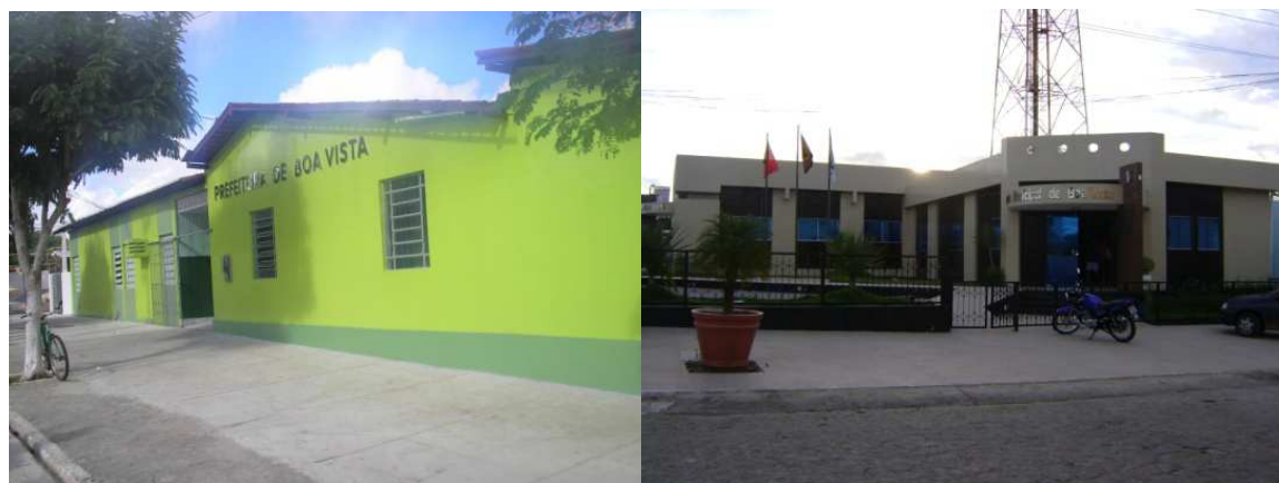
Figuras 13 e 14: Prefeitura Municipal e Câmara Municipal de vereadores. Maio de 2011.

De acordo com a Prefeitura Municipal, além das residências, na sede urbana há cerca de quinhentos imóveis públicos, dentre estes, constam cinco templos religiosos, um católico e seis evangélicos; dois prédios escolares, um estadual e outro municipal; uma sede da prefeitura municipal e uma sede da câmara de vereadores (Figura 13 e 14); uma biblioteca municipal, uma Delegacia de Polícia Civil; um cartório de registros civil, nascimentos e óbitos; um mercado público; um posto médico municipal; um posto de combustíveis; uma creche municipal; uma sede do clube de mães; uma agência dos Correios; uma agência bancária; três largos e três praças públicas; um ginásio poliesportivo, entre outros.