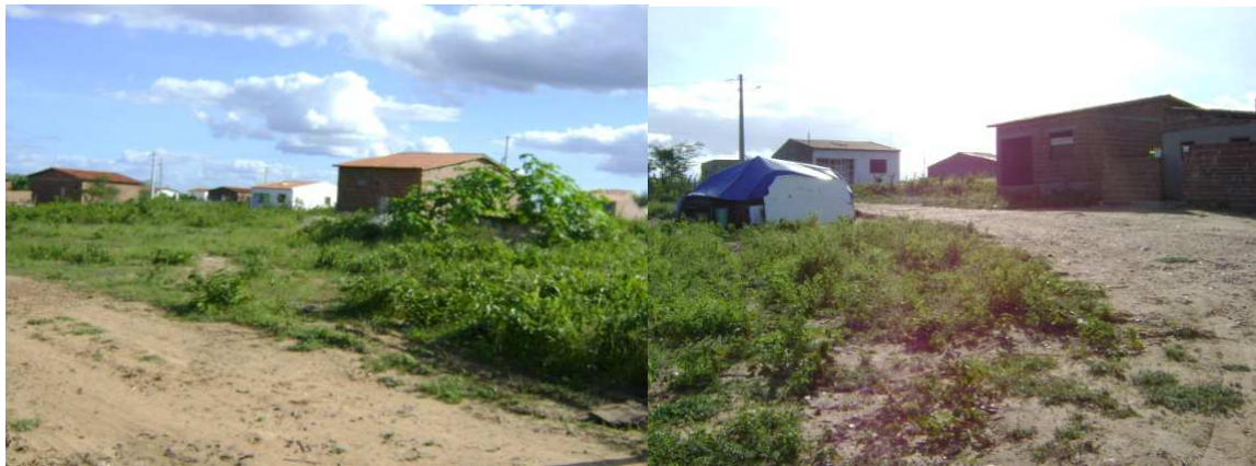
Figuras 17 e 18: Comunidade Alto Bonito. Maio de 2011.

Outro problema a ser apontado é o surgimento de alguns pontos que poderão, futuramente, se tornar pequenas favelas nas periferias da área urbana do município, são cerca de 30 construções desorganizadas que se encontram nesses locais, é o caso da comunidade Alto Bonito (Figuras 16 e 17), cuja população vem crescendo consideravelmente, de forma desorganizada. Na área também existem alguns pontos de comércio, conforme podemos observar nas imagens abaixo.