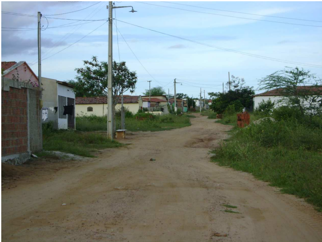
Figura 04: Comunidade Cachoeirinha, onde percebe-se o fenômeno da rurubanização. Maio de 2011.

características rurais (Figura 04). De acordo com Maia (2005), concordando com os escritos de Gilberto Freyre, o espaço rurubano se caracteriza pela imbricação entre o espaço rural e o urbano. Neste sentido, pode-se perceber diversar áreas do município, as quais, embora encontrem-se inseridas em área urbana, de acordo com os órgãos administrativos da cidade, possuem um modo de vida ligados à terra, ao campo, ou seja, um modo de vida rural. Este fato faz com que sejam, com base em Maia (2005), consideradas áreas de rurubanização. Conforme pode-se perceber na figuras 04.