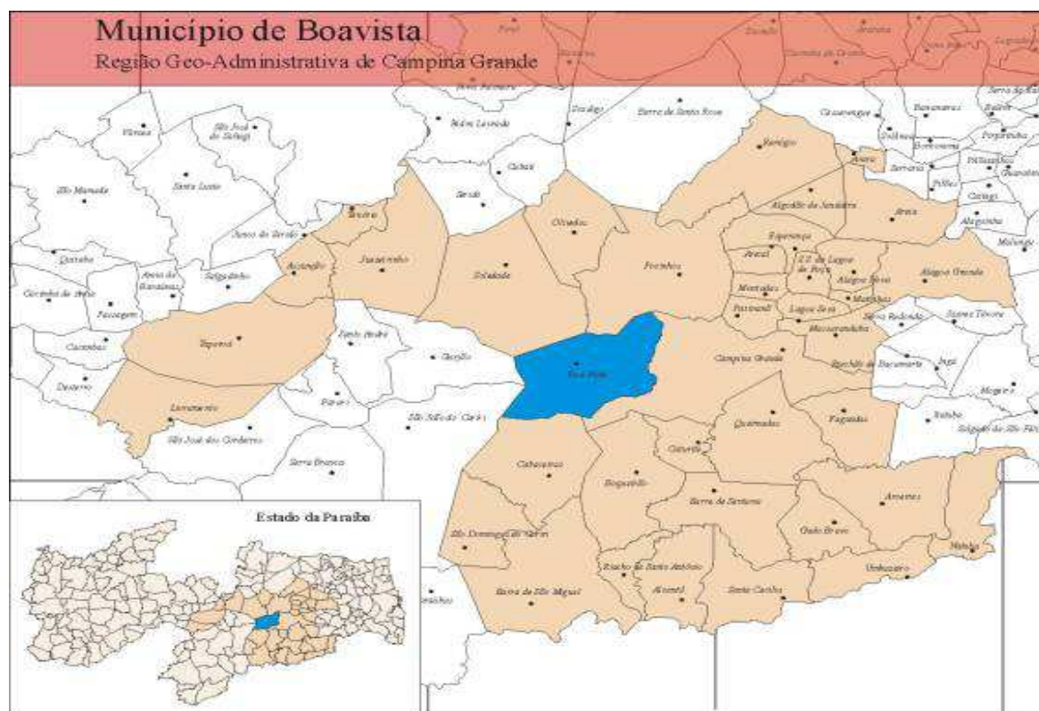
Figura 01: Localização do município de Boa Vista. Organização: Juliana Alcântara, maio de 2011

de 11,7 hab/Km 2 . Limita-se ao norte com os municípios de Pocinhos e Soledade, ao sul com os municípios de Cabaceiras e Boqueirão, ao Leste com o município de Campina Grande e ao oeste com os municípios de Gurjão e São João do Cariri (Figura 01).