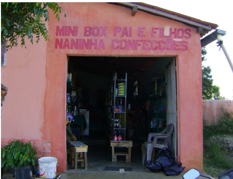
Figura 19: Comunidade Alto Bonito: Ponto de comércio da localidade. Maio de 2011.

Nesse sentido é importante analisar a área enfocada aqui, já que esta é uma área que desenvolve atividades rurais. Entretanto, de acordo com a Prefeitura Municipal, essa área já corresponde a zona urbana. Nesse cenário também é válido salientar a existência de terrenos baldios onde se encontram lixo e esgoto à céu aberto. Porém, graças a vários benefícios promovidos pelo poder público nos últimos anos, Boa Vista se destaca por ter um alto índice de crescimento demográfico, e, por ser um município com boas expectativas de empregos, pela existência do extrativismo mineral, mesmo que não se possa negar a ocorrência desses problemas.