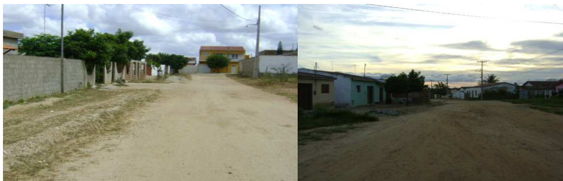
Figuras 15 e 16: Ruas José Felizardo de Araujo e Pedro Soares, exemplos de algumas ruas sem calçamento e rede de esgoto. Maio de 2011.

Conforme observado anteriormente, o município de Boa Vista se evidencia em vários fatores. Entre eles a importância de ser produtora da Bentonita e o crescimento demográfico verificado nos últimos anos, porém apresenta problemas. Um deles é que, mesmo com a existência de uma Delegacia de Polícia e do baixo índice de violência, a população sofre com a falta de segurança e de policiais. Além disso, existem na cidade ruas que são desprovidas de calçamento e de rede de esgotos e que, por isso, causam transtornos, principalmente em épocas chuvosas (Figuras 15 e 16).