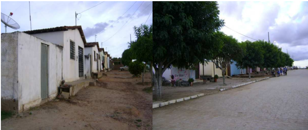
Figuras 05 e 06: Conjunto habitacional Doutor Demétrio de Almeida. Maio de 2011.

Conjunto João Vitorino Sobrinho com 45 residências (Figuras 07 e 08), construído logo após.