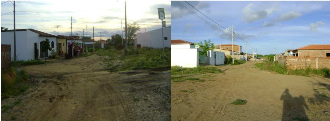
Figuras 09 e 10: Rua João Vitorino de Araujo, fenômeno da expansão urbana. Maio de 2011.

Sobre os loteamentos criados no município nos últimos anos, sobretudo, nos anos que seguem a sua emancipação, enfatiza-se o loteamento conhecido como loteamento de Raulino, conforme demonstrado nas Figuras 09 e 10.