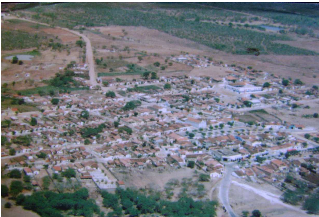
Figura 11: Imagem aérea da área urbana de Boa Vista no ano de 2000.

Analisando as imagens a seguir, vale salientar a considerável mudança no espaço urbano do município de Boa Vista. No ano de 2000, este se concentrava no centro do município (Figura 11). No ano de 2010, esse espaço já tomava outras proporções (Figura 12).