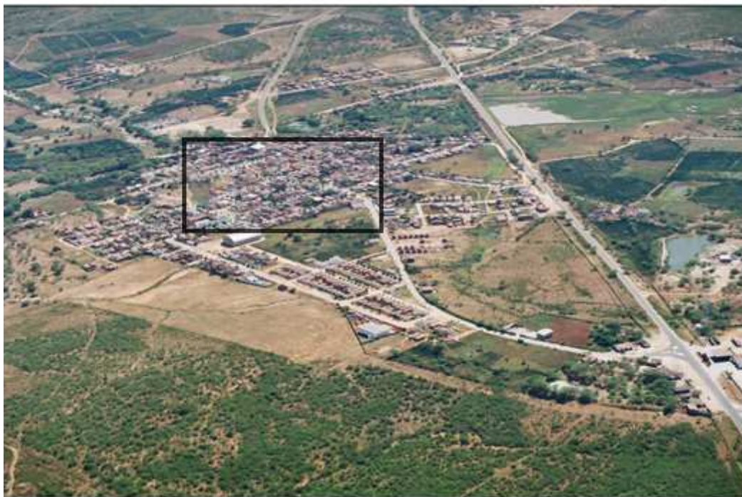
Figura 12: Imagem aérea da área urbana de Boa Vista no ano de 2010.

Comparando as duas imagens, observa-se que a segunda fotografia (Figura 12) apresenta uma área de expansão que vai além da área em destaque, a qual encontrava-se apresentada com detalhes na imagem anterior (Figura 11). Esta análise permite perceber que houve um rápido avanço da área edificada do município de Boa Vista, sobretudo após sua emancipação. Salienta-se que vários foram os fatores para a ocorrência desta expansão, conforme será abordado a seguir.