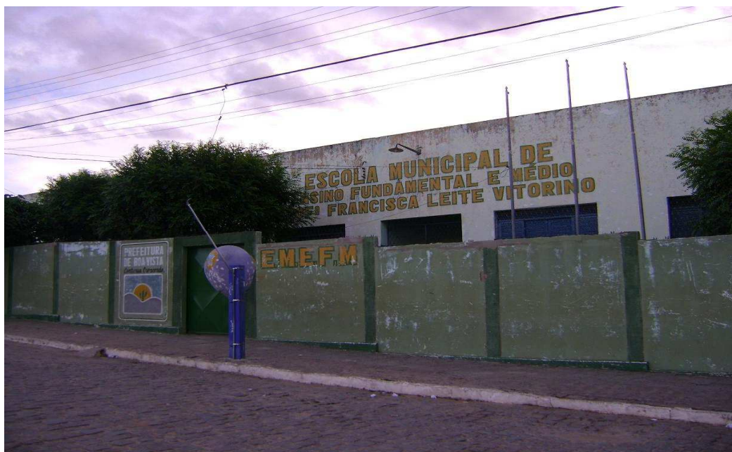
Figura 03: Escola Municipal Francisca Leite Vitorino. Maio de 2011.

A partir dos anos 1980 e principalmente na década de 1990 (com a emancipação em 1994), o espaço se amplia tanto no sentido Oeste-Leste quanto no Sul. Essa ampliação pode ser atribuída a alguns fatores, como a migração rural-urbana intra-municipal; a criação de postos de emprego, promovidos pela industrialização da bentonita e pela criação do quadro de funcionários do município; além da migração do retorno, principalmente de aposentados que residiam em outras cidades. Segundo Santos (2008 b),