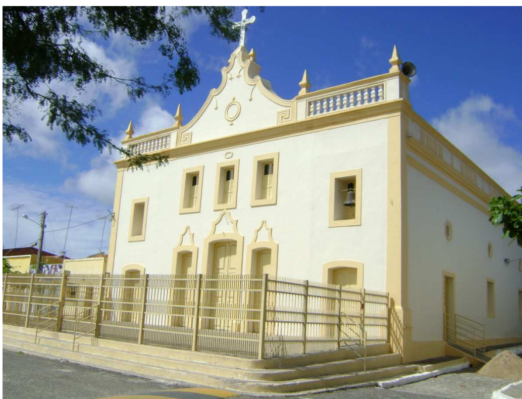
Figura 02: Igreja do Bom Jesus dos Martírios. Maio de 2011.

De acordo com Soares (2003), o núcleo urbano do município de Boa Vista surgiu com o erguimento da Igreja do Bom Jesus dos Martírios, a qual pode ser observada na figura 02. Sua construção se deu sob influenciada pela forma de concepção de formação urbana colonial lusitana, que parte da edificação de uma igreja ou capela para o processo de urbanização.