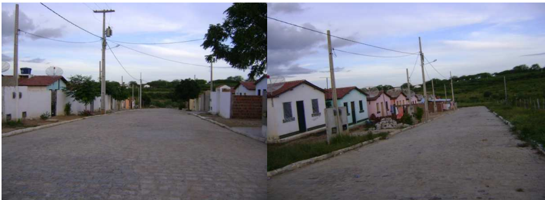
Figuras 07 e 08: Conjunto habitacional João Vitorino Sobrinho. Maio de 2011.

Analisa-se aqui a importância da emancipação do município para a construção destes, já que partiu de obras municipais, onde as casas eram doadas às famílias mais carentes do município. Faz-se ainda referência ao aumento dos loteamentos surgidos nos últimos anos os quais tem-se apresentado também como fator marcante para o fenômeno da urbanização. Neste sentido, Rodrigues (1989, p. 26) afirma que: