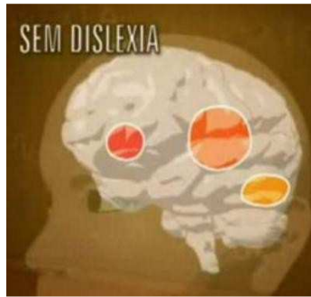
Figura 4: Diferença entre um cérebro com e sem dislexia

Já numa pessoa com dislexia, as áreas atrás e do meio (cor amarela e laranja) são menos ativadas do que o normal, então para compensar isso nos disléxicos, a parte da frente (vermelha) é forçada a trabalhar mais e até o lado direito é acionado durante o ato da leitura, como mostra figura 5.