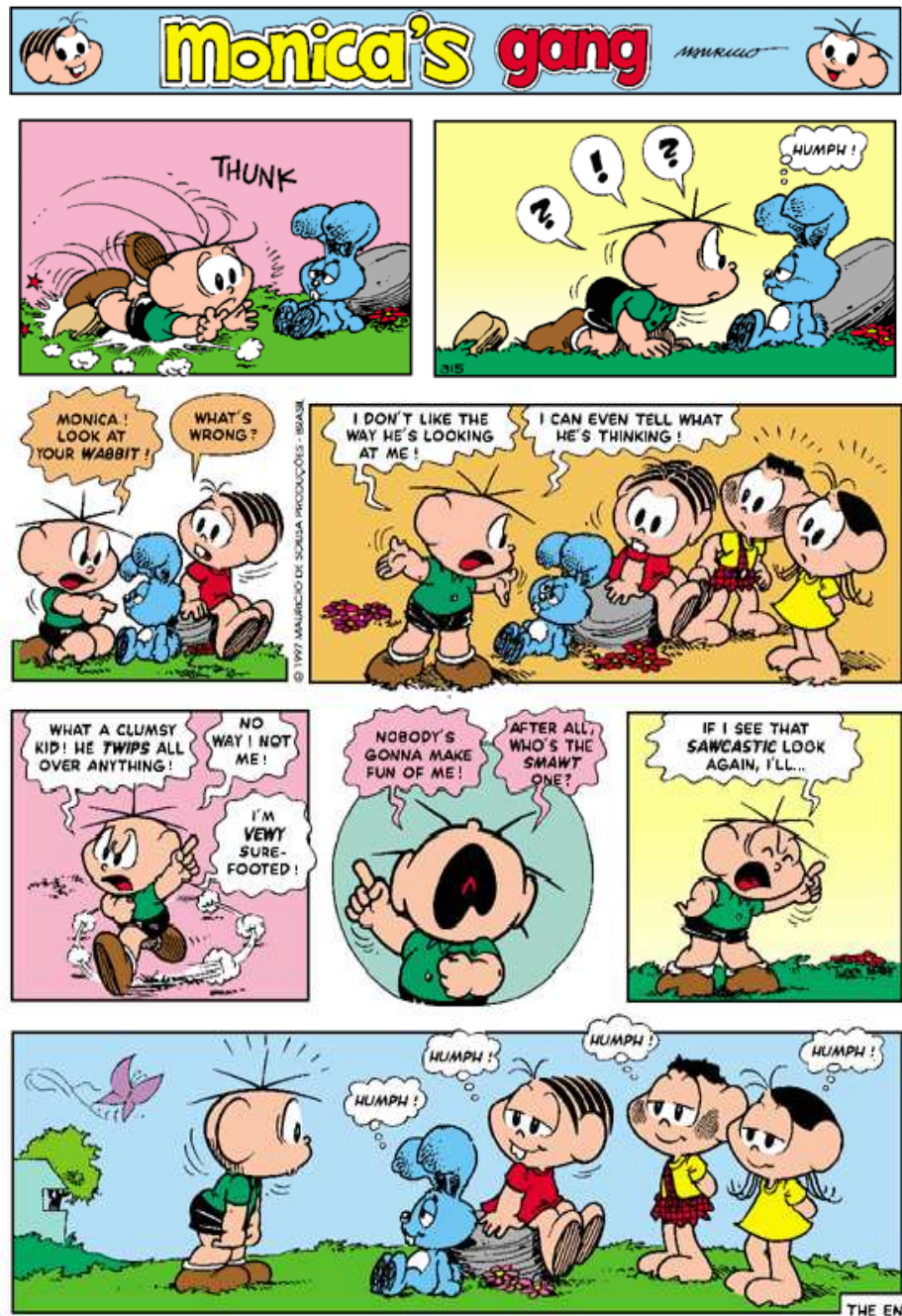
Figura 6: História em quadrinhos, Turma da Mônica.

(Fonte: http://www.monica.com.br/ingles/comics/cabeca/pag2.htm . Acessado em: 24 de Novembro de 2011).