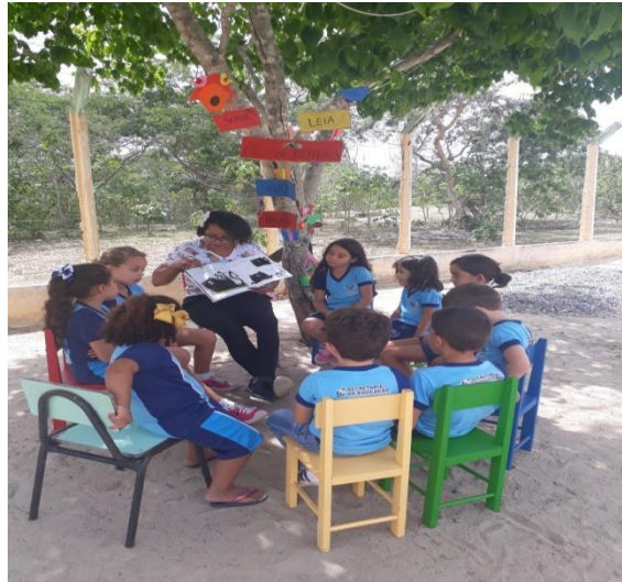
Figura 5 – Professora e alunos em aula campal