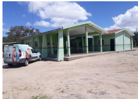
Figura 2 – Escola Municipal Américo Porto