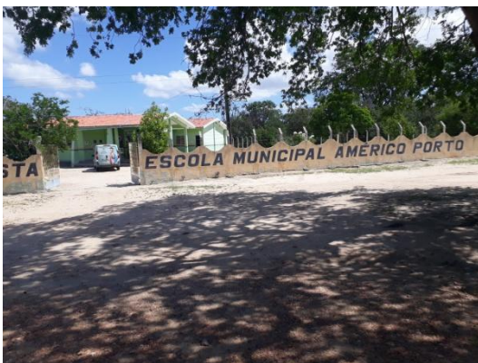
Figura 1 –Área frontal da Esc. Mun. A. Porto