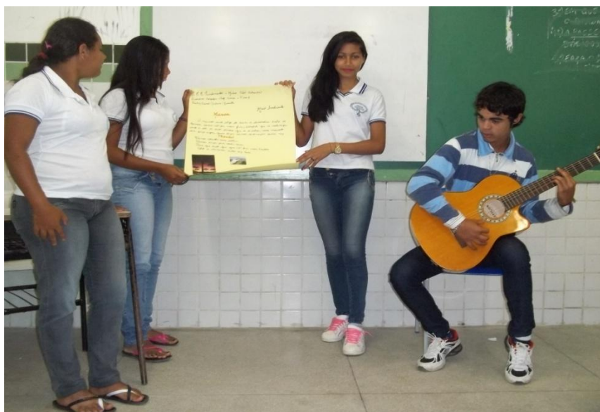
Figura 3: Apresentação dos trabalhos dos alunos do 7º ano “A”.

Fonte: Giusepp C. da Silva, Setembro de 2013.