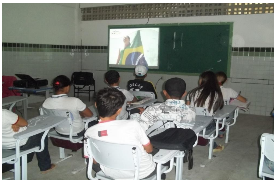
Figura 2: Alunos da turma do 7º ano “A” em sala de vídeo.