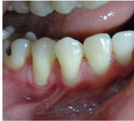
Figura 3 – Aspecto clínico das recessões gengivais dos elementos 44 e 45