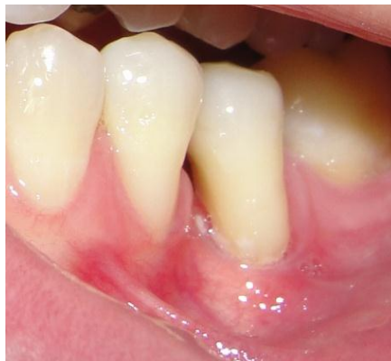
Figura 2 – Aspecto clínico das recessões gengivais dos elementos 34 e 35