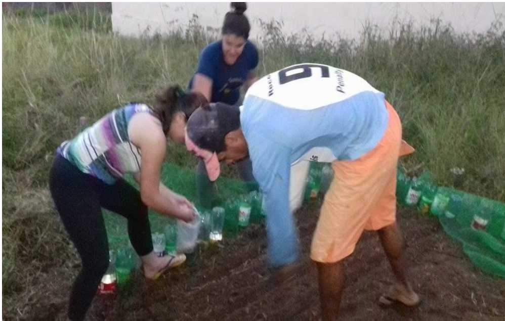
Fotografia 5–Plantando as sementes