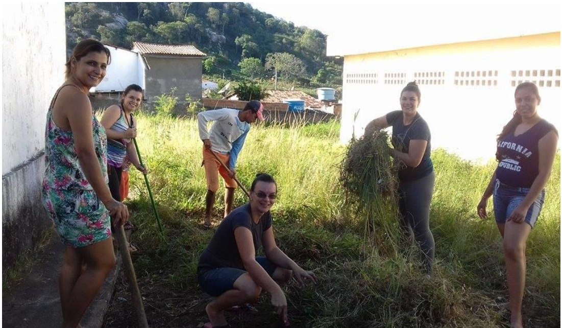
Fotografia 2 –A limpeza no terreno da escola