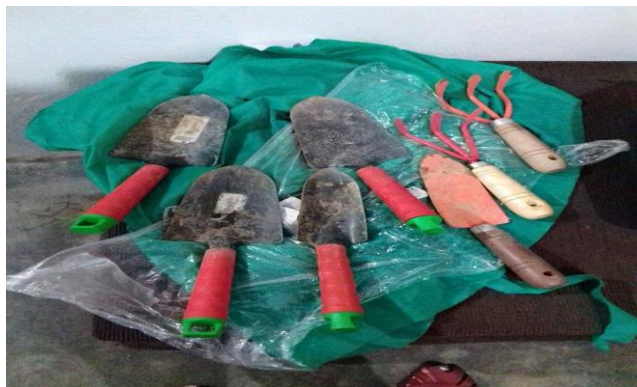
Fotografia 3: Ferramentas utilizadas durante o plantio

O local apropriado para o cultivo das hortaliças deve apresentar terra plana, terra fofa, voltada para o sol, disponibilidade de água para irrigação, longe de ambientes com pouco transito de pessoas e animais. É importante para que se realize uma horta seja pela orientação de um agrônomo ou técnico agrícola, também é importante saber se na própria escola já tem alguma prática sobre o cultivo de hortaliças, e se essa pessoa poderá ajudar.