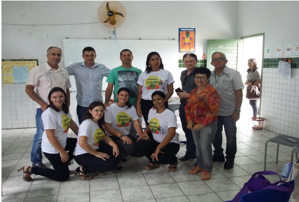
Fotografia 1 – Nossos colaboradores