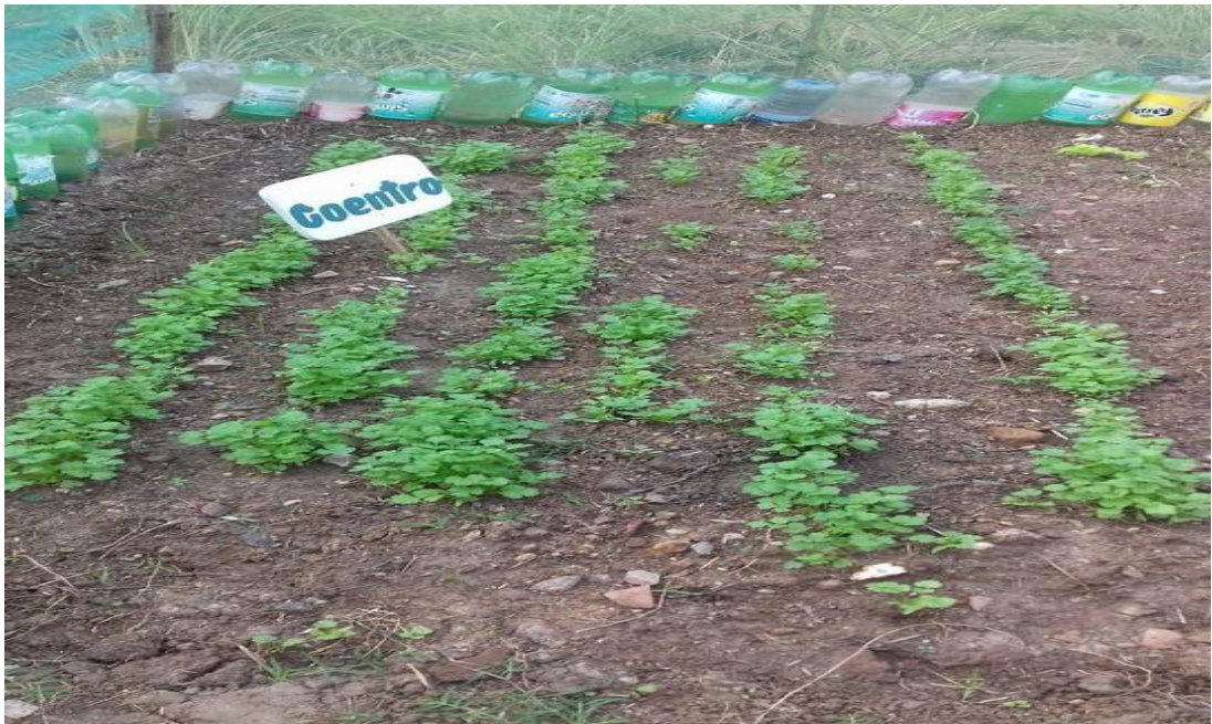
Fotografia 6- Sementes nascendo