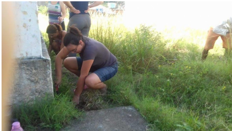
Fotografia 4– Preparando o terreno

Antes de iniciar o preparo dos canteiros, deve-se limpar o terreno com auxílio de algumas ferramentas como enxada, chibanca e carrinho de mão. Como auxílio de uma enxada, retira-se a terra de uns 15 cm de profundidade, com a chibanca, desmancham-se os torrões retirando as pedras e outros objetos e nivelando o terreno.