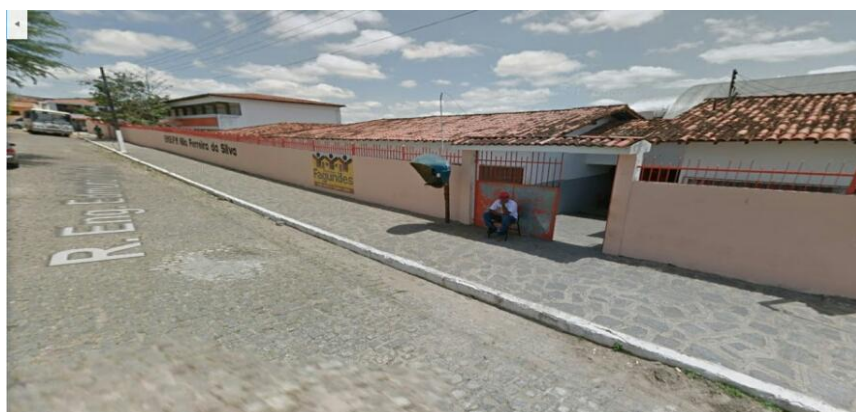
Figura 1: Escola da pesquisa

E, finalmente, foi feita uma pesquisa de campo, que oferece maior contato com o público-alvo e aproximação com o fenômeno social e educacional estudado. Este tipo de pesquisa segundo Marconi (2005, p.125), “baseia-se na observação dos fatos tal como ocorrem na realidade”. A pesquisa foi realizada em uma escola da Rede Municipal onde foi desenvolvida o estagio supervisionado II, localizada avenida Irineu Bezerra no Município de Fagundes-PB.