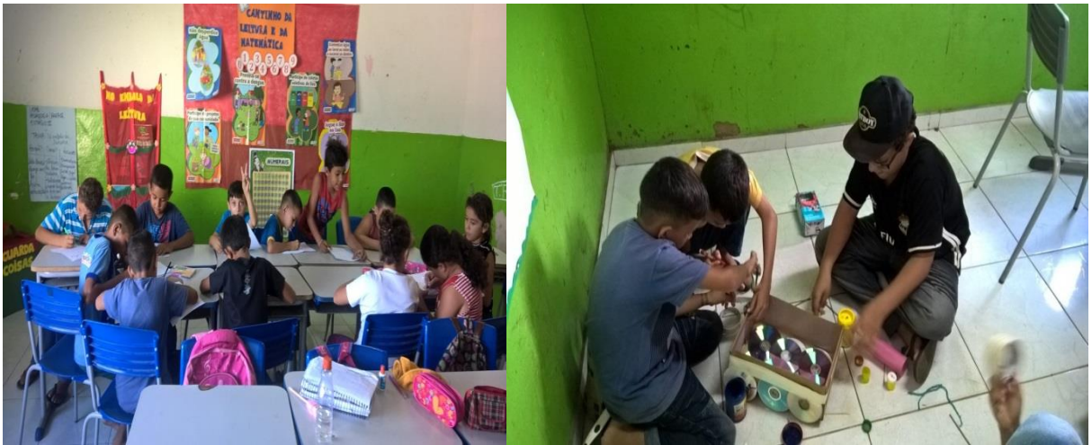
Primeiras atividades realizadas com os alunos do 4º ano, produções textuais e confecção de brinquedos com material reciclado.