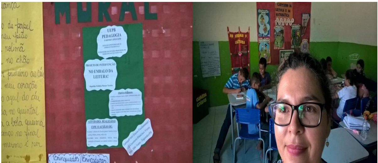
Construção do projeto de leitura e ludicidade com a turma do 4º ano