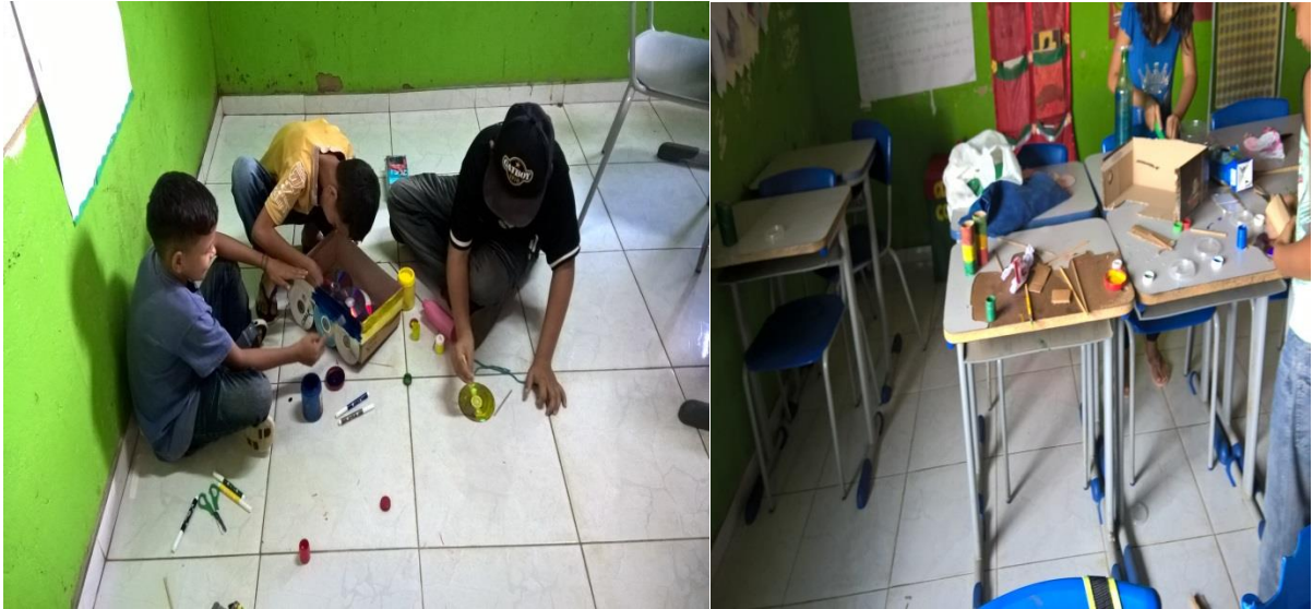
Primeiras atividades realizadas com os alunos do 4º ano confecção de brinquedos com material reciclado.