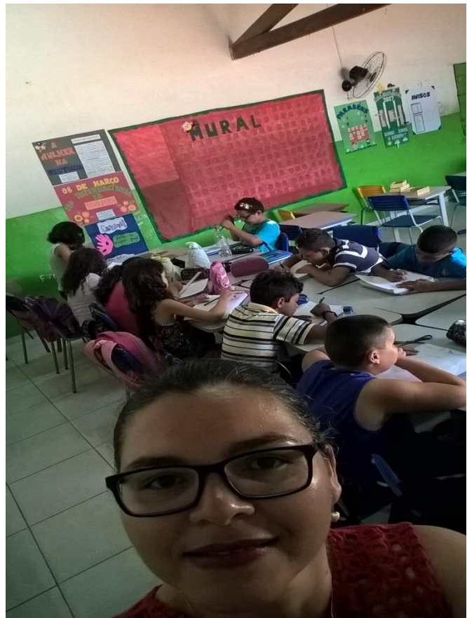
Primeiras atividades avaliativas após a implantação do projeto leitura e ludicidade.