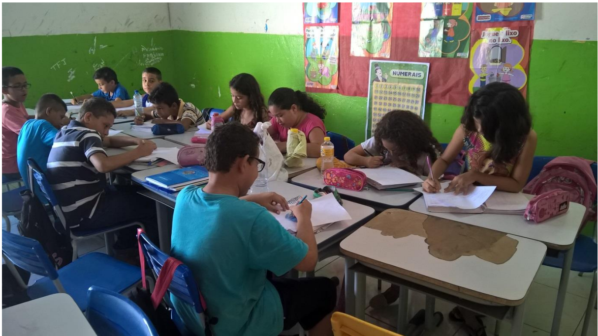
Atividades realizadas com os alunos do 4º ano, produções textuais.