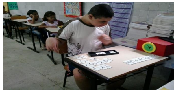
Escola Municipal de Ensino Infantil e Fundamental Cícero Virgínio Fonte: da autora

Assim, buscar informações e organizar momentos de formação para cada seguimento da comunidade escolar, foi uma forma de mostrar aos pais, funcionários, professores e principalmente aos alunos, que a inclusão é possível.