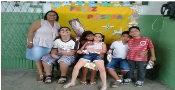
Escola Municipal de Ensino Infantil e Fundamental Cícero Virgínio