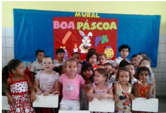
Escola Municipal de Ensino Infantil e Fundamental Cícero Virgínio