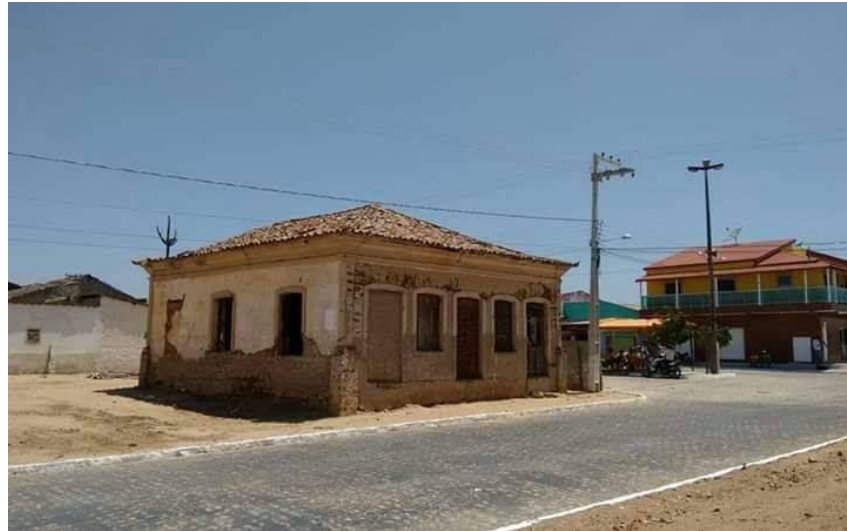
Figura 2: Casa atribuída a Teodósio de Oliveira Ledo