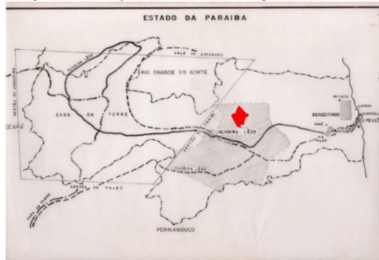
Figura 5: Localização de Olivados-PB no mapa de Wilson Seixas

Fonte: Mapa adaptado de Wilson Seixas, em O Velho Arraial de Piranhas.