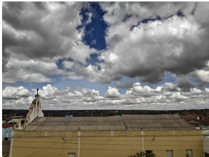
Figura 3: Vista lateral da igreja de São Sebastião, Olivedos-PB

Os olivedenses atribuem essa casa as possessões de Teodósio, teria sido neste casarão que o sertanista passou os seus dias no povoamento do território da Fazenda São Francisco. Para além disso o que o relato de Nobrega Filho nos mostra é que a necessidade de ampliação da capela local bem como a atribuição da casa da sede da fazenda à figura do colonizador mostra que a fazenda São Francisco, de início, era formada, ao menos, pela casa da sede e a capela, cujos terrenos 17 do entorno foram, posteriormente, usados para o cemitério local.