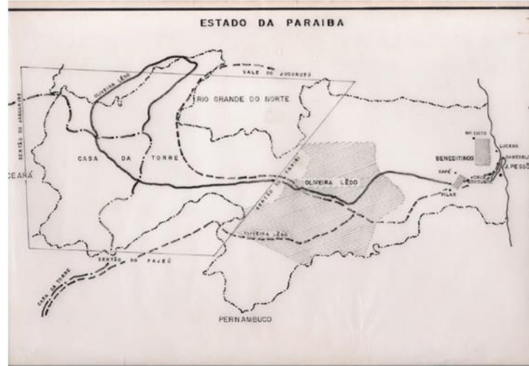
Figura 4: Terras dos Oliveira Ledo, nas primeiras décadas de ocupação

Fonte: Mapa de Wilson Seixas em O Velho Arraial de Piranhas,