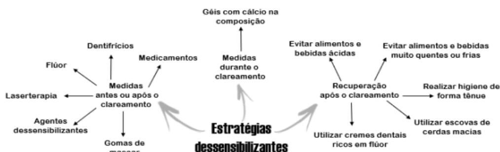
Figura 2 - Estratégias dessensibilizantes utilizadas durante, antes ou após o clareamento dental.

Com o intuito de reduzir a sensibilidade, pesquisadores estão utilizando vários protocolos, como redução na frequência e duração da aplicação do gel, a aplicação de flúor, uso de dentifrícios, compostos diferentes que foram adicionados nos agentes dessensibilizantes e nos géis de clareamento, analgésicos e antiinflamatórios, laserterapia e cuidados após o clareamento foram identificados como estratégias capazes de diminuir a SD sem no entanto, comprometer a eficácia do tratamento clareador (REZAZADEH et al., 2019) (FIGURA 2).