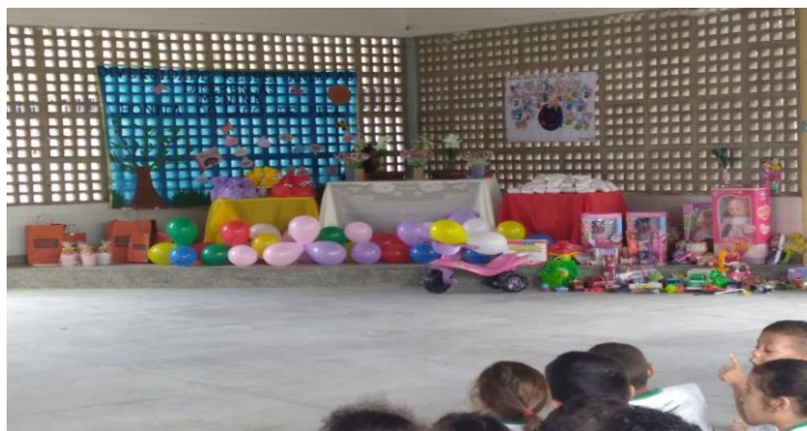
Figura 5 - Culminância

No último dia de estágio foi realizada a nossa culminância, que teve a participação das outras estagiárias. Depois de tudo arrumado, as crianças foram para o pátio com as professoras, a gestora e a supervisora da creche. Iniciamos a nossa culminância fazendo uma breve fala sobre o estágio, sua importância e agradecendo sobre a colaboração de todos da instituição, pela receptividade a qual fomos recebidas. Passado a fala, demos início às apresentações das crianças começando pelo berçário I, onde os bebês dançaram ao som do chocalho com muita alegria, depois foi à vez da turma do pré- II, as crianças fizeram a contação da história com o avental da (menina bonita do laço de fita), uma apresentação dinâmica que teve a participação de vários alunos da turma, a partir da narrativa, os colegas que estavam com os personagens iam colando no avental, o Campo de experiência: Escuta, fala, pensamento e imaginação, foi contemplado nessa atividade, pois as crianças ouviam a história e imaginavam e pensavam bem concentradas no que estava fazendo, momento muito rico para a aprendizagem, por último foi a nossa apresentação, que aconteceu através da música (Ser diferente é normal) de Jair Oliveira, música que fala das diferenças, que existe gente de toda crença e de toda raça, gente alta, baixa gorda e magra.