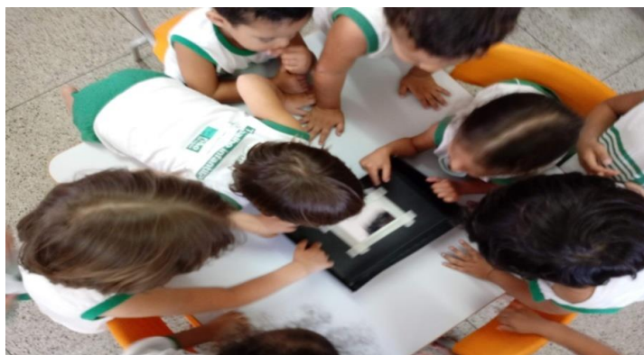
Figura 3 - Dinâmica do espelho