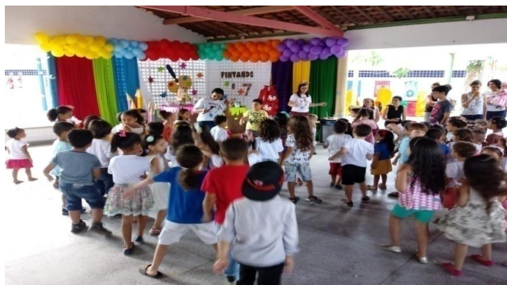
Figura 4 - Comemoração dia das crianças

No quinto dia de estágio, depois do lanche, fomos ensaiar a música (normal é ser diferente), em pouco tempo elas já sabiam cantar o refrão da música, dançavam e faziam gestos com o corpo, de acordo com o que a letra da música pedia, também cantamos a música de não atire o pau no gato, trabalhando as diferentes linguagens do corpo, através das expressões. Uma das professoras pediu para que as crianças parassem as brincadeiras, pois estavam atrapalhando, ressaltamos para elas que não tinha problema, pois é brincando que se aprende, sendo garantido um direito de aprendizagem como é colocada na BNCC (BRASIL, 2017) por meio das diferentes linguagens, como a música, a dança, o teatro, as brincadeiras de faz de conta, elas se comunicam e se expressam no entrelaçamento entre corpo, emoção e linguagem. Depois entregamos uma folha com um desenho de um laço que iríamos utilizar na construção de um cartaz, deixamos os lápis de pintar à disposição das crianças para que assim tivessem autonomia da escolha da cor, depois apresentaram a pintura que tinham feito cada uma do seu jeito. Conforme terminavam entregávamos uma folha em branco para que desenhassem de forma livre.