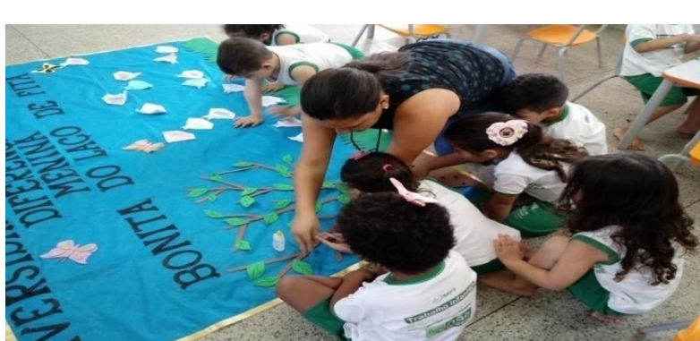
Figura 2 - Montagem do painel

O respeito ao tempo de cada criança é imprescindível, cada uma tem o seu próprio ritmo, portanto não podemos rotular a criança sobre qualquer aspecto. Depois que terminamos colocamos o painel no chão e também enfeitamos a jabuticabeira do nosso painel, conforme alguns terminavam e, com a ajuda das professoras, as crianças tomavam água e eram liberadas para o recreio.