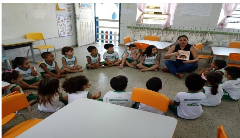
Figura 1 - Leitura do livro

É necessário promover ações que possibilitem a participação das crianças como protagonistas das suas próprias aprendizagens. A leitura da história menina Bonita do Laço de Fita foi feita em roda de conversa, onde elas puderam se expressar e recontar a história apreciando as imagens do livro, que traziam aspectos diferentes como os coelhinhos de várias cores e também a menina bonita do laço de fita. Silva, Dias e Amorim (2018, p. 254) afirmam que “A escolha desses livros para a utilização com crianças de 0 a 3 anos oportuniza que a diversidade étnico-racial, chegue às creches apresentando aspectos culturais e estéticos”. Sendo assim um grande aliado para as práticas pedagógicas. Depois de contar a história, a criança citada acima, chegou perto de mim e me mostrou o laço dela que estava na cabeça fazendo referência à história que havia sido contada. Trazer essa história para as crianças fez com que elas se sentissem envolvidas, representadas e importantes. Esse momento de interação com as crianças além de permitir o fortalecimento das relações entre adultos e crianças, foi construído laços fraternais que transcenderam as expectativas. Dentre os acontecimentos o mais importante que pudemos perceber foi à descoberta das crianças sobre as diferentes características que cada uma possui como cor da pele, cabelo, cor dos olhos.