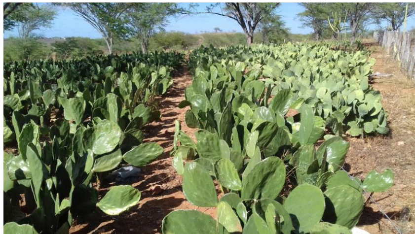
Figura 1. Área implantada com palma forrageira em Taperoá-PB