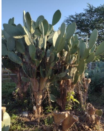
Figura 3: Palma Gigante ( Opuntia ficus-indica Mill)