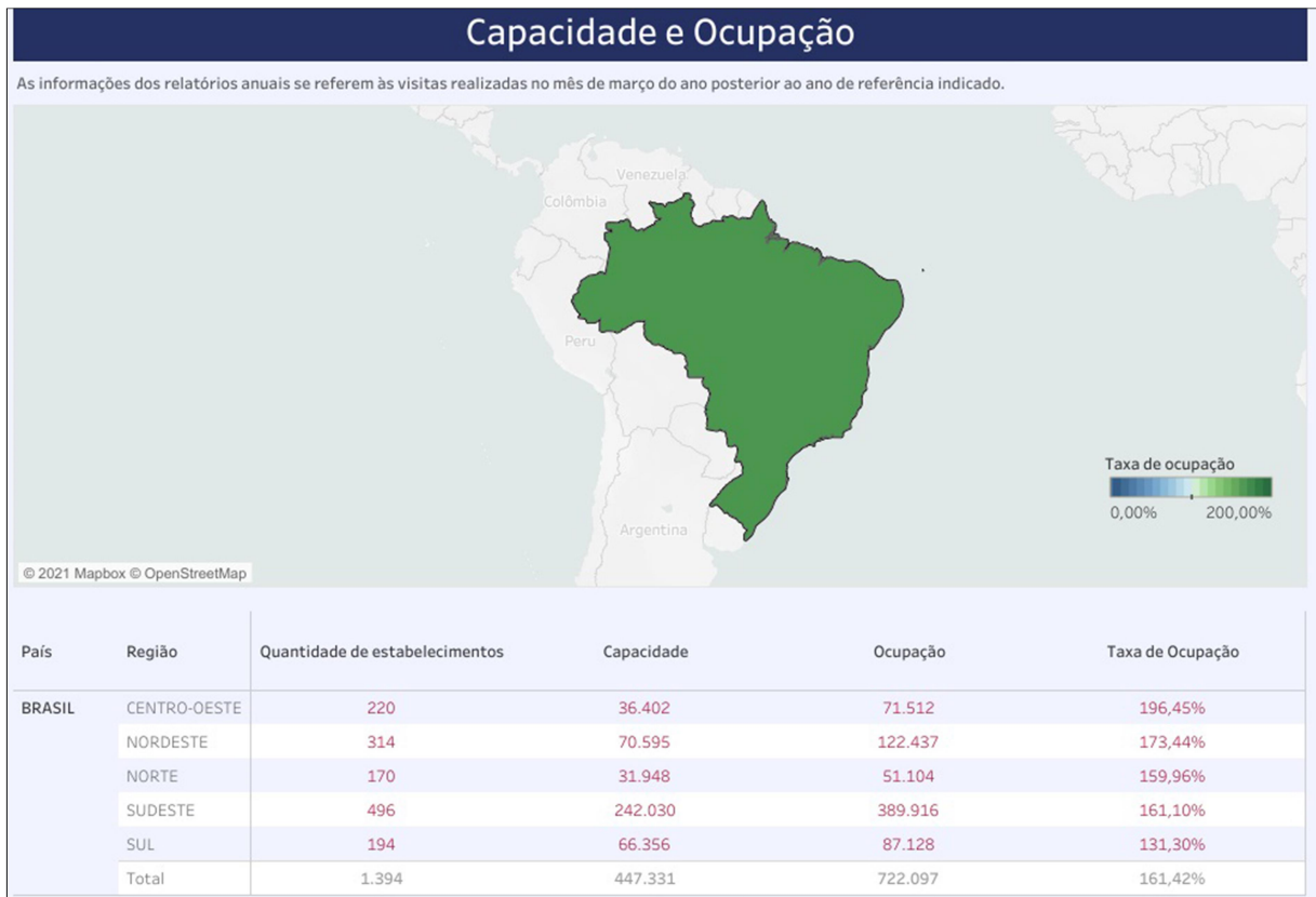
Figura 2 - Mapa Gráfico com Tabela - Capacidade e Ocupação (Sistema Prisional)