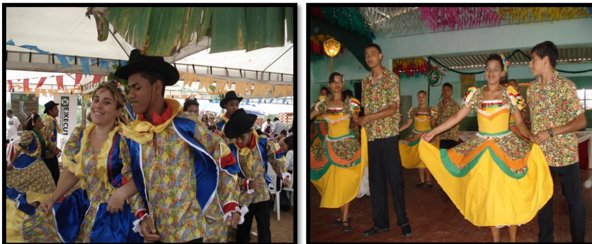
Imagem 5: Grupo de Dança do PETI – Bananeiras

O Grupo de Dança Folclórica do PETI está ligado aos programas sociais representados pela secretaria de Desenvolvimento Social da cidade, os participantes são crianças e adolescentes do PETI – Programa de Erradicação do Trabalho Infantil. Sua manutenção está associada a verba direcionada ao programa, ou seja, quando necessário o grupo utiliza esse recurso. As principais danças são Xaxado, Araruna, Boi de Reis, Quadrilhas, Pastoril, Xote, Camaleão, etc.