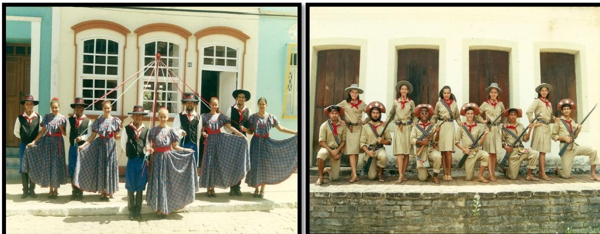
Imagem 3: Grupo de tradições Folclóricas Moenda