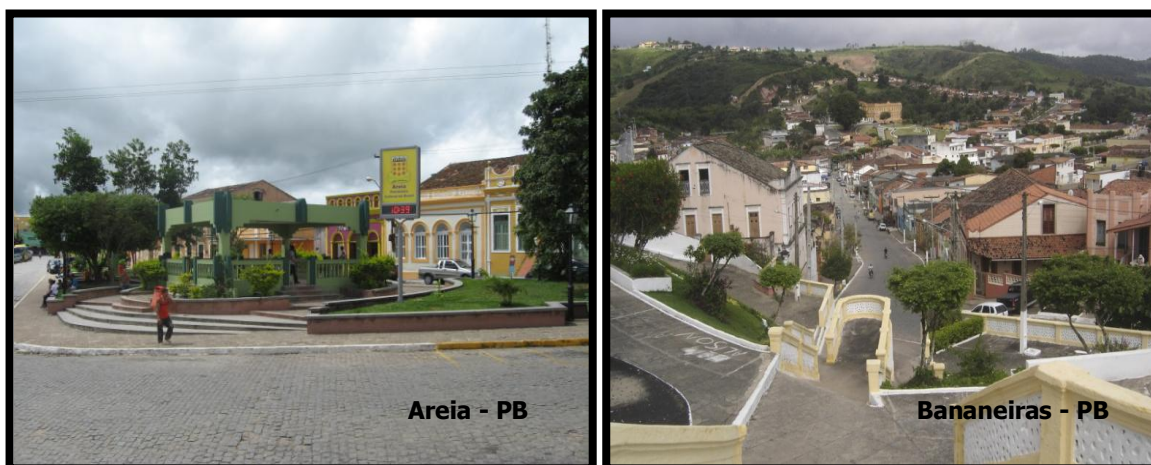
Imagem 1: Areia e Bananeiras/PB.

Considerando os dados já apresentados no Quadro I, os municípios de Areia e Bananeiras (Imagem 1) possuem diferentes equipamentos de lazer, sendo alguns privados como, o clube AABB, Haras, Pesque Pague, Hotel do Golfe e a maioria espaços públicos como trilhas, cachoeiras, a praça, museus, biblioteca e outros. O que se identifica nessas cidades investigadas é uma falta de uso ou subutilização dos mesmos por parte da população e, ao mesmo tempo, dos gestores em apresentar projetos para que todos independentemente de classe sócio-econômica possam usufruir de tais espaços. Por exemplo, estabelecer parcerias com o setor privado.