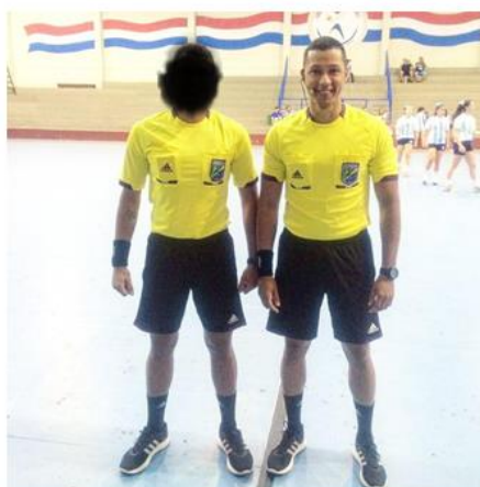
FOTO 5: ATUAÇÃO COMO ÁRBITROS NACIONAIS ASPIRANTES CONTINENTAIS NO SULAMERICANO DE HANDEBOL