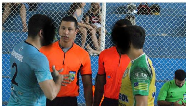
FOTO 4: ATUAÇÃO COMO ÁRBITROS NACIONAIS ASPIRANTES CONTINENTAIS NO SULAMERICANO DE HANDEBOL