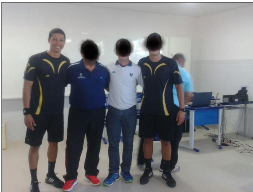
FOTO 2: ATUAÇÃO COMO ÁRBITRO NACIONAL NOS JOGOS ESCOLARES DA JUVENTUDE