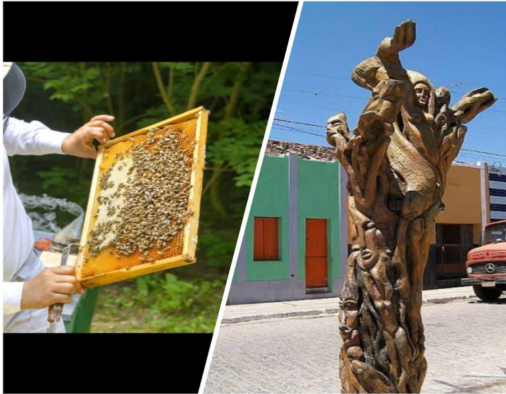
Figura 04 - Apicultura e artesanato no município de Livramento - PB

renda de muitas famílias que habitam nesse bioma, que podem alavancar a economia da região auxiliando na sustentabilidade e preservação do mesmo.