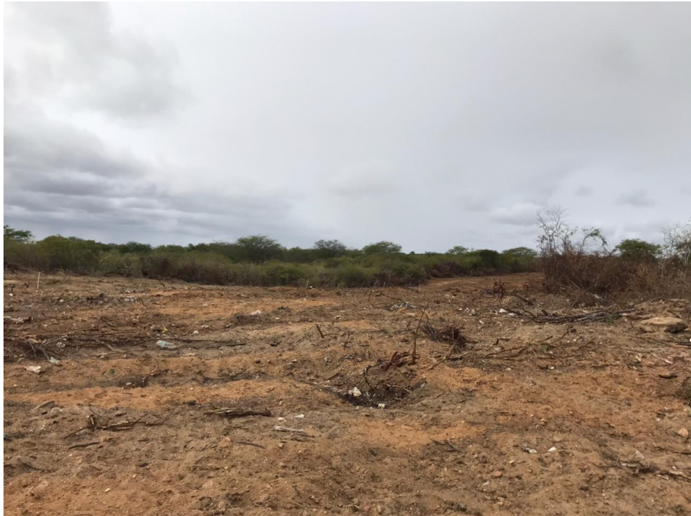
Figura 02 - Desmatamento localizado na zona rural do município de Livramento-PB.