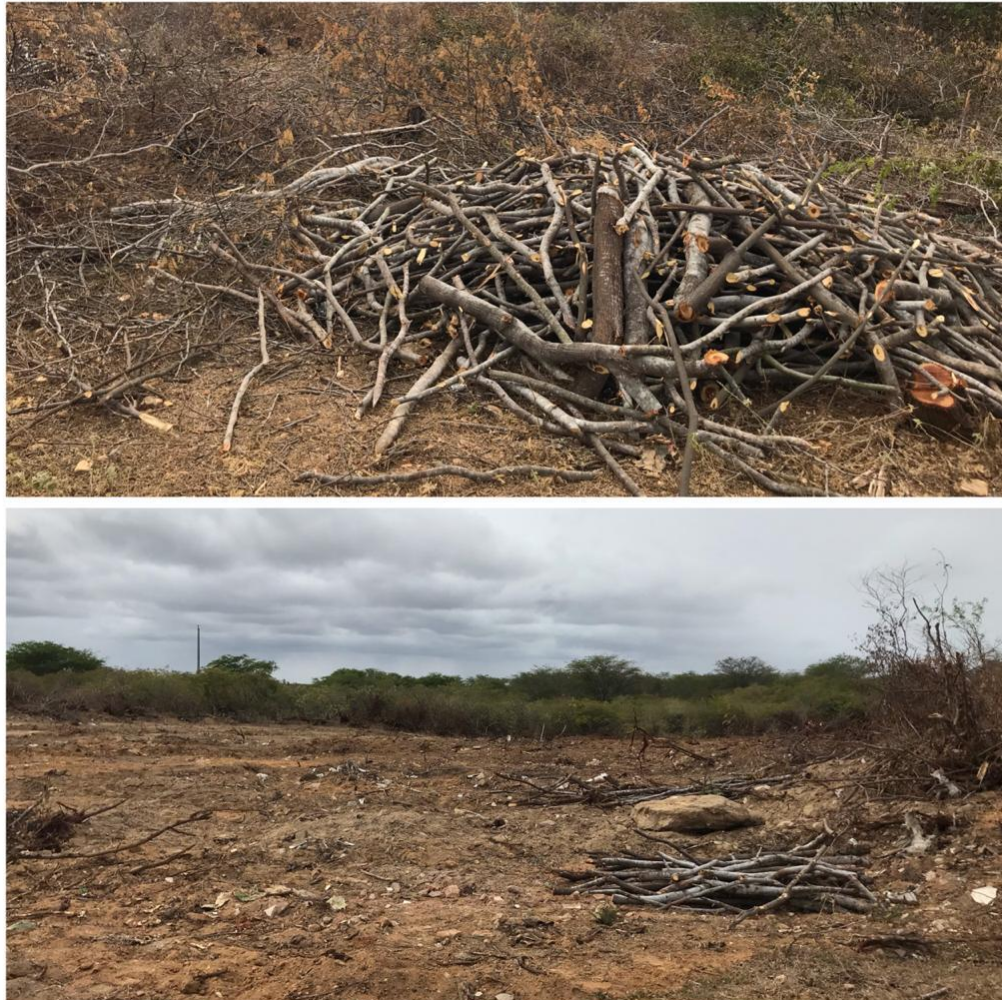
Figura 05 - Exemplo de práticas errôneas desenvolvidas por habitantes do bioma Caatinga no município de Livramento-PB.