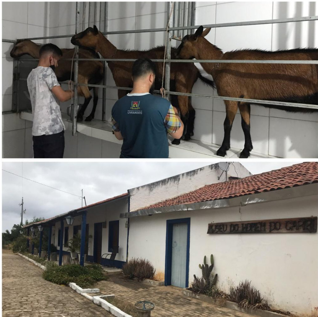
Figura 03: Caprinocultura e turismo desenvolvidos no município de Livramento-PB.