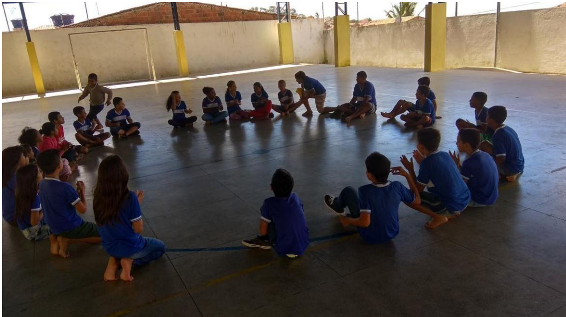
Imagem 01: brincadeira popular pique-pega