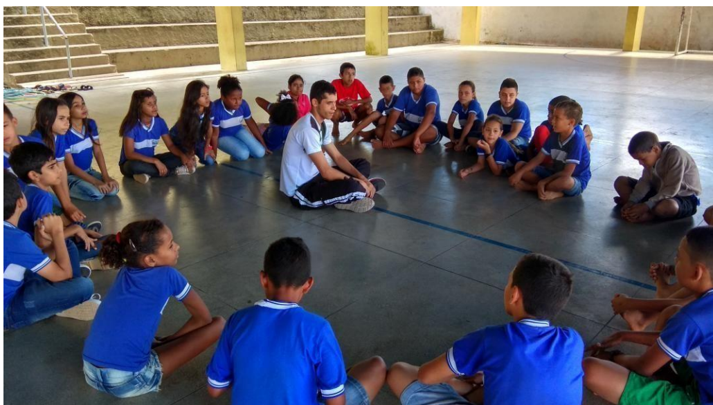
Imagem 06: roda de conversa