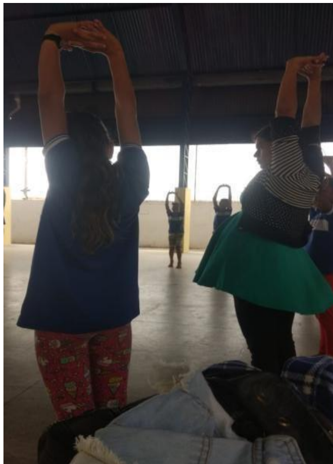
Imagem 07: alongamento