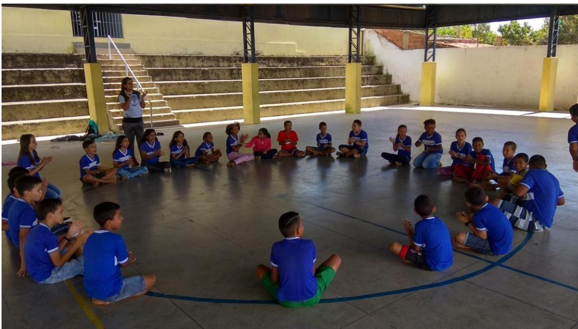
Imagem 03: cantiga de roda