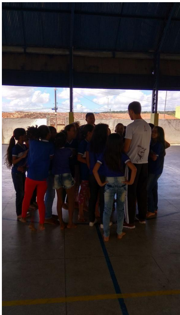
Imagem 05: reconhecimento dos limites do corpo