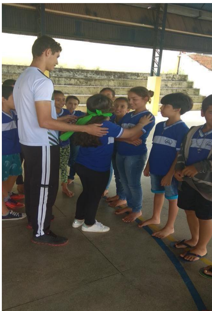
Imagem 04: reconhecimentos dos limites do corpo