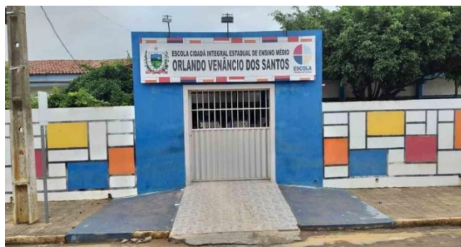
Figura 2 - Imagem da frente da Escola Cidadã Integrada Orlando Venâncio