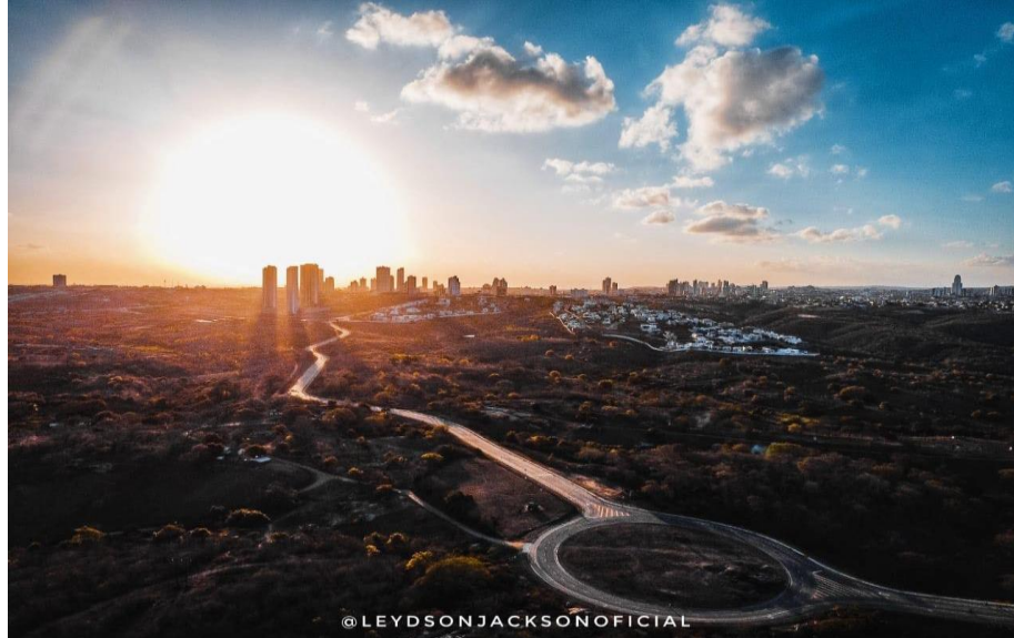
Foto 11 - Alça Leste

remetem as festas juninas e também a cidade. Em seu espaço existe uma praça de alimentação e música ao vivo nos finais de semana.