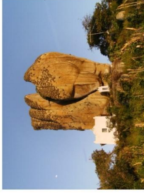
Vista da pedra de Santo Antônio em Fagundes-PB

O trecho dessa música retrata a crença do povo nordestino, especialmente das mulheres que sonham encontrar um companheiro e subir ao altar. A Pedra de Santo Antônio , localizada no município de Fagundes (PB), tem a fama de "desencalhar pessoas e unir casais", ou seja, diz a lenda que: quem passar entre suas fendas e tiver fé em Santo Antônio, se casa ligeirinho! Mito ou realidade, o fato é que todos os anos, no dia 13 de junho, data que se comemora o dia de Santo Antônio (Santo casamenteiro) uma multidão percorre um longo caminho até chegar a essa pedra que tem cerca de 30 metros de altura. Segundo a tradição, o casamento acontece dentro de um ano se a pessoa