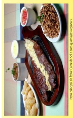
Prato principal do fest. Carne de Sol e suas guarnições regionais

O Festival da Carne de Sol acontece na cidade de Picuí-PB, denominada a capital mundial da carne de sol, que celebra todos os anos a gastronomia nordestina com seus pratos irreverentes e cheios de sabor. São 04 dias de muita diversão, com premiação para o maior comilão de carne de sol do mundo, gincana e concurso da garota carne de sol. São distribuídos em torno de 10 mil reais em prêmios, amostras de produtos regionais, feiras e exposições de produtos artesanais, além de apresentações culturais e atrações musicais na praça de evento da cidade. Pra quem gosta de carne, não pode ficar de fora dessa!