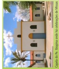
Capela do Sr. Ibiapina onde há celebrações de Missas