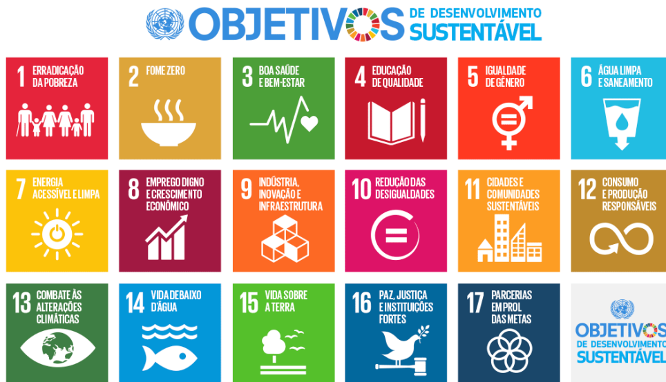
Figura 1 - Objetivos de Desenvolvimento Sustentável

O tema passou a ser bastante relevante durante e após a Conferência das Nações Unidas sobre Meio Ambiente e Desenvolvimento (CNUMAD), conhecida como Rio-92. Diversas conferências mundiais e os seus debates serviram de impulso para que a Organização das Nações Unidas (ONU) promovesse a criação dos 17 Objetivos de Desenvolvimento Sustentável (ODS), abordando as dimensões social, econômica e ambiental do desenvolvimento sustentável, que se desdobram em 169 metas aplicável a todos os países (ODS BRASIL, 2022).