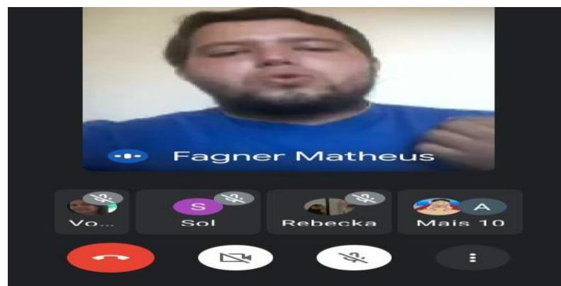
Figura 1 - Aula de História ministrada através do aplicativo Google Meet

No início do ano letivo de 2021, novas estratégias pedagógicas relacionadas ao uso das tecnologias foram adotadas, as aulas passaram a ocorrer em tempo real, através do aplicativo Google Meet . Como resultado, a interação entre professor-aluno melhorou, e foi possível promover debates, compartilhar ideias e experiências. Entretanto, o número de estudantes que tinham a possibilidade de frequentar as aulas por videoconferência era bastante reduzido, sendo necessário unir mais de uma turma da mesma série. Geralmente, apesar do estudante estar inserido no grupo da sua turma de WhatsApp , por vezes, não participava das aulas porque seu aparelho celular era incompatível com o aplicativo Google Meet .