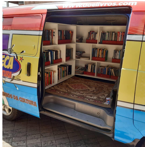
Figura 1 – Interior da Vanteca