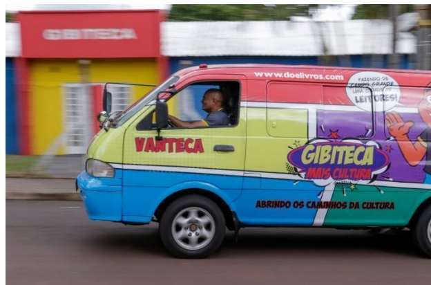
Figura 2 – Ronilço Guerreiro dirige a VanTeca