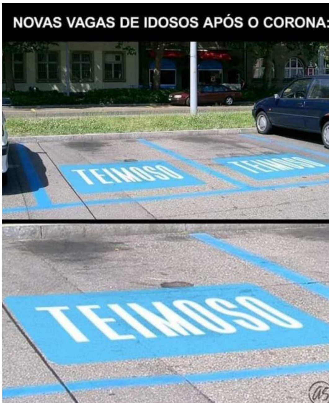
Figura 3 – Meme da reserva de vaga para idosos