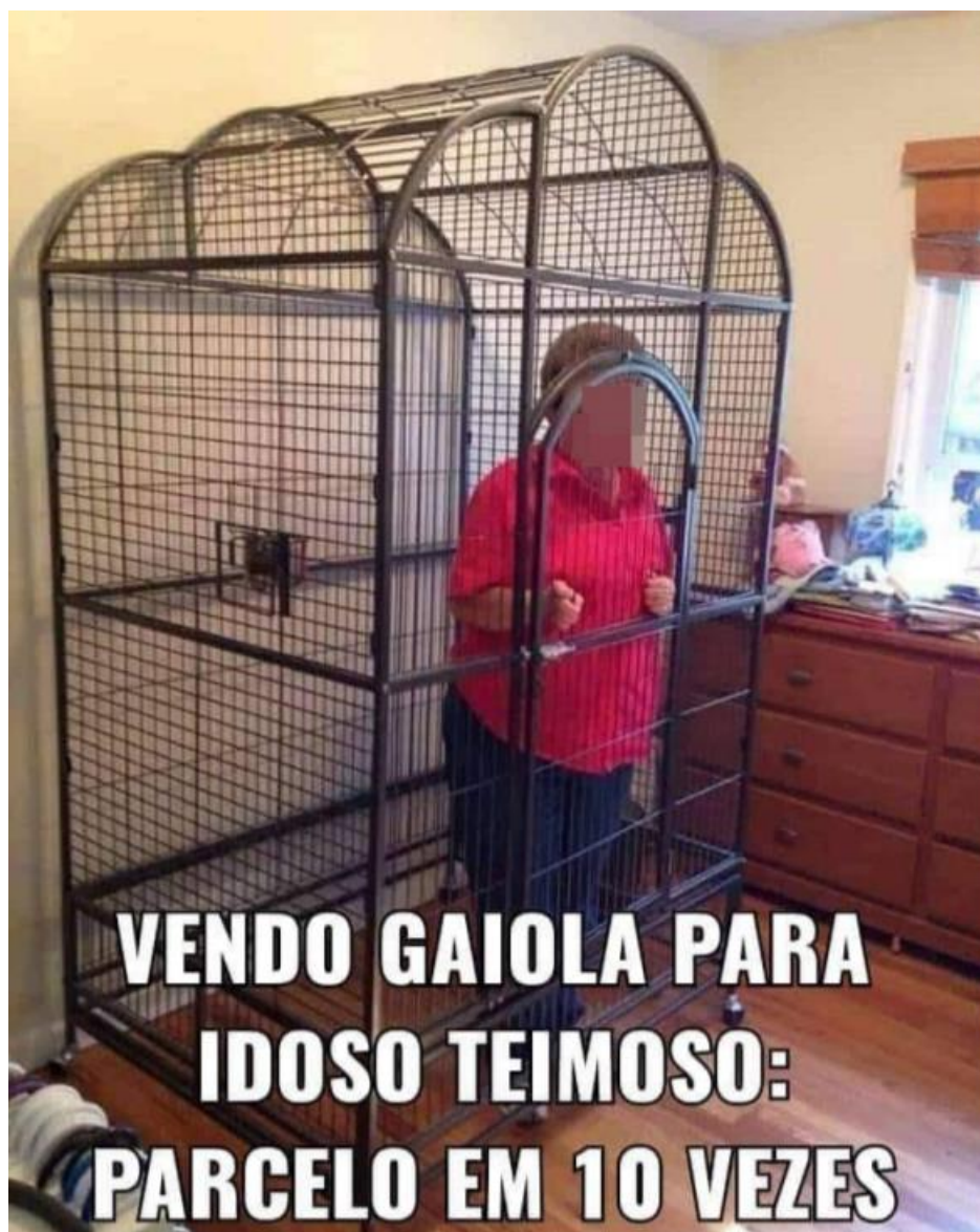
Figura 4 – Meme da gaiola para idoso teimoso