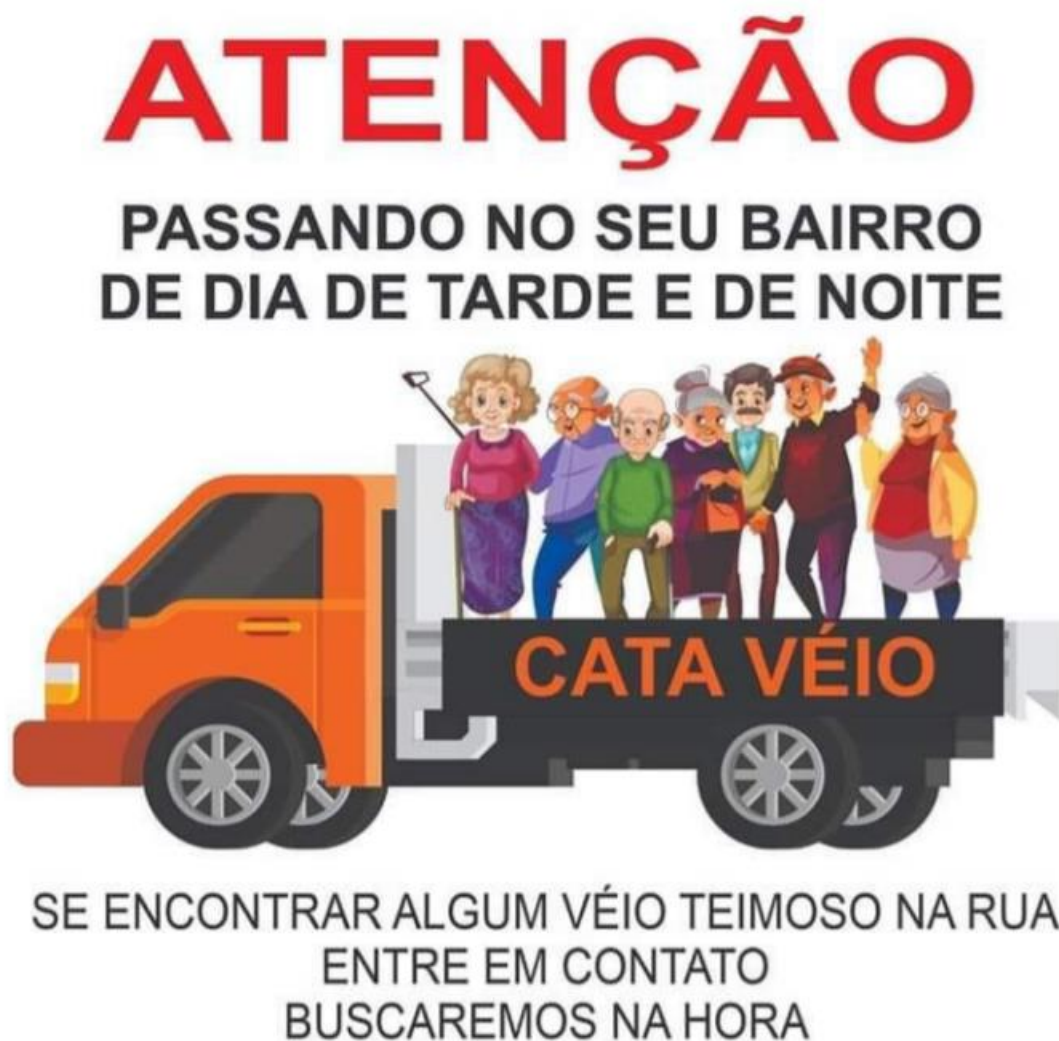
Figura 1 – Meme do “cata véio”