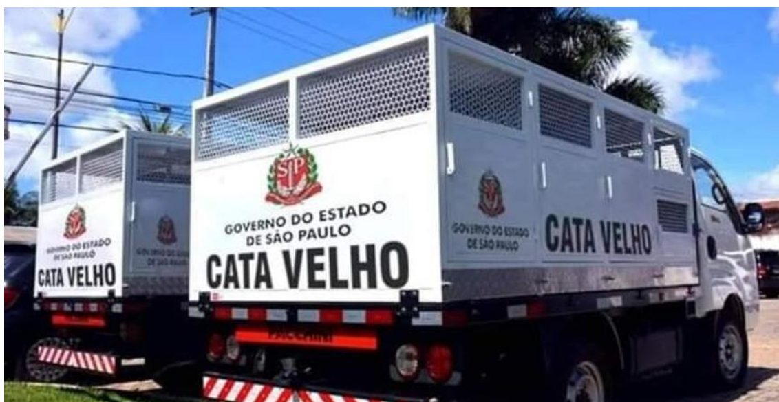
Figura 2 – Meme do “cata velho”