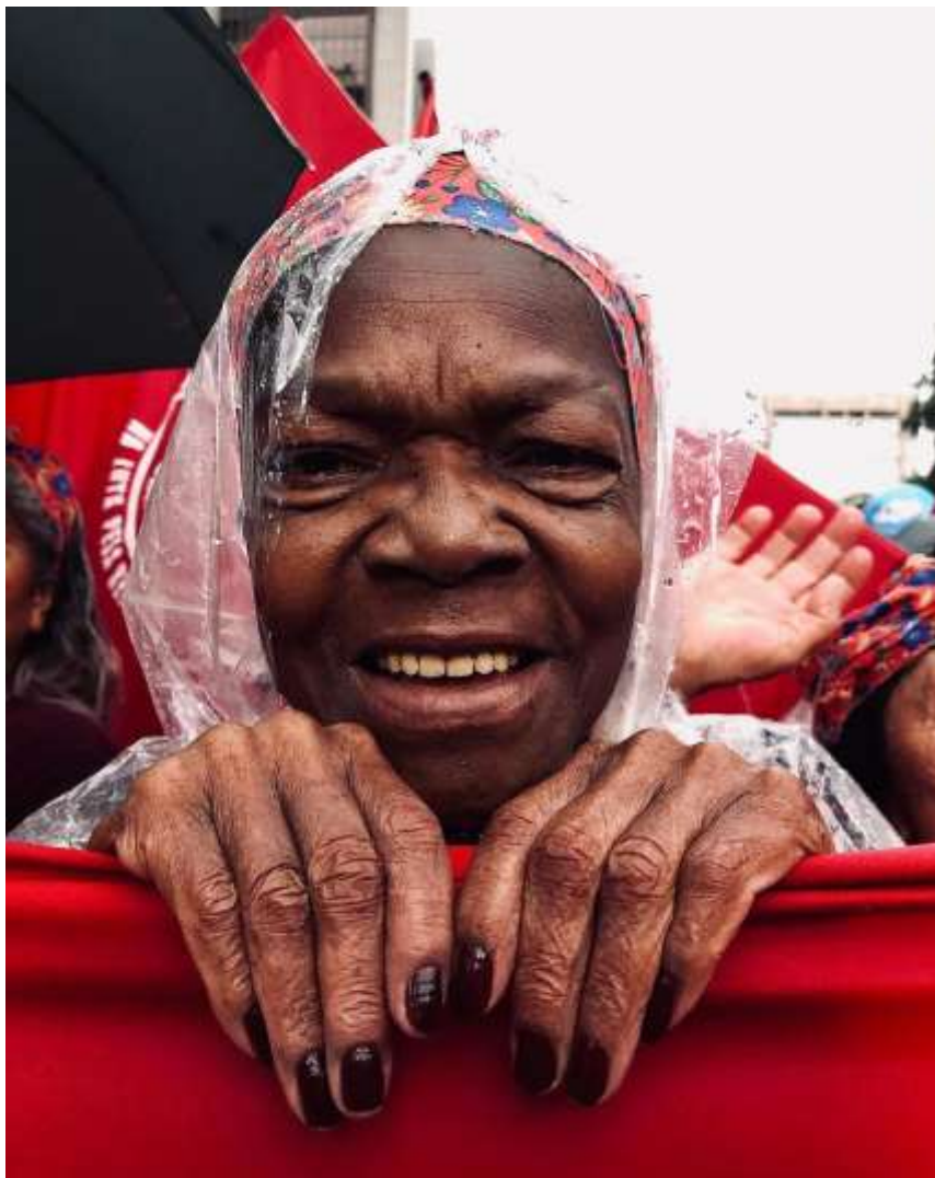
Figura 3 – “8 de março - Marcha das mulheres, Av. Paulista, 2020”