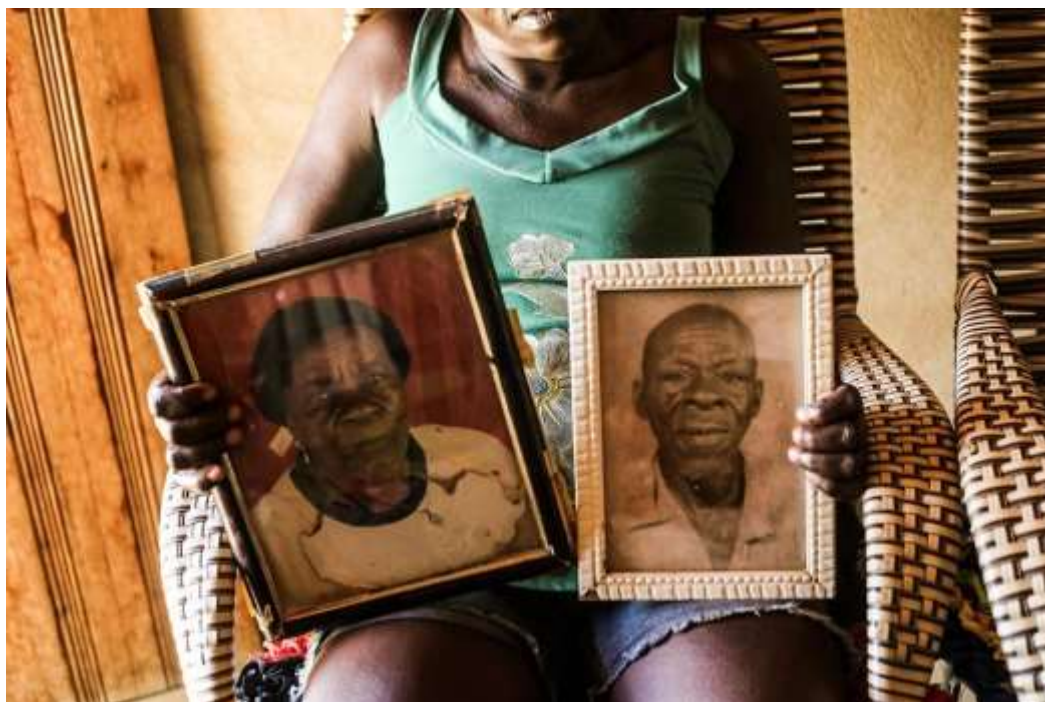
Figura 1 – “Caminhos do Sertão”