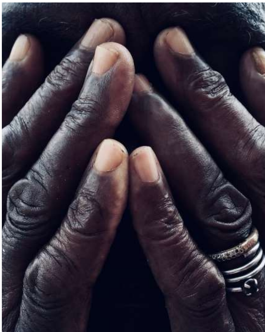
Figura 4 – “O breu da mata escura e o silêncio da noite, 2019”

Com um passado cercado de memórias cujos relatos sempre tiveram como narrador pessoas alheias à história, e um presente inundado de suposições, a vida das mulheres negras resiste aos estereótipos depois de sobreviver às pequenas e grandes violências diárias. A reivindicação de lugar, espaço, e fala é diária, e exige a ocupação de espaços diversos, como a fotografia. Nayara descentraliza as produções, foge do lugar comum de representar a personagem dentro de algum dos “padrões” usuais, e compõe uma imagem que sugere que, unidas à resistência da marcha de 8 de março estão a disposição de quem sempre precisou lutar, e a alegria por ter o direito de resistir. As mãos da mulher sobre a faixa possuem destaque na cena e, como veremos a seguir com outros, as mãos negras protagonizam muitas das imagens de autoria de Jinks.