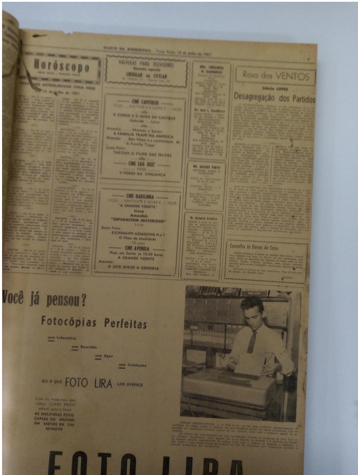
Fonte: LOPES, Stênio. Desagregação dos Partidos. Diário da Borborema . Campina Grande, 18 jul. 1961. p. 7. (Acervo DBO – DAPress e Biblioteca Atila Almeida – UEPB).