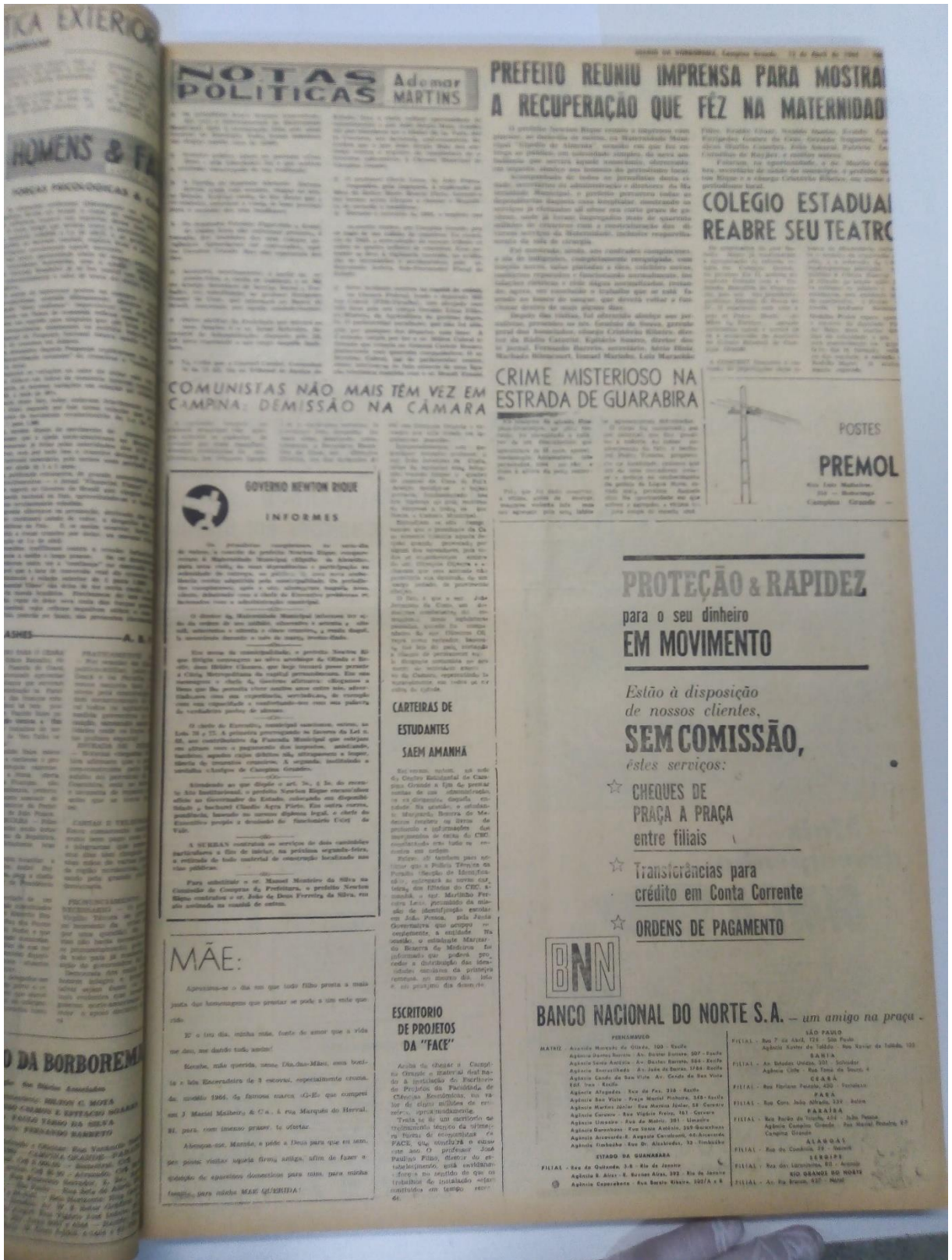
Fonte: Comunistas não mais têm vez em Campina; Demissão na Câmara. Diário da Borborema . Campina Grande, 12 abr. 1964. (Acervo DBO – DAPress e Biblioteca Atila Almeida – UEPB).