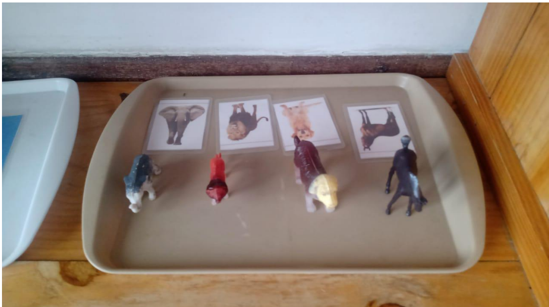
Figura VII – Bandeja de atividade de associação e reconhecimento

A caixa de cores é um material Montessori que permite o contato da criança com as cores primárias e secundárias, possibilitando o reconhecimento e associação de cores.