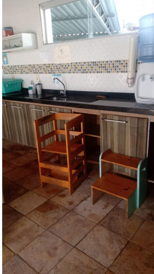
Figura XVII – Cozinha externa

O espaço acima é para o uso das crianças maiores, o ambiente da psicomotricidade das crianças menores estava em manutenção, já que era o momento de férias das crianças.