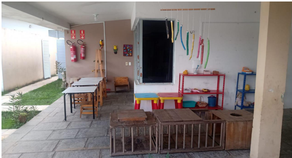
Figura XVIII – Espaço externo para oficinas de artes

Percebemos que a cozinha está adaptada para que a criança consiga realizar as atividades sozinhas.