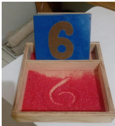
Figura XIII – Números de lixa e caixa de areia

Igualmente a sala G1, a G2 irá ter a presença de bandejas com diversas atividades e muitos materiais Montessori.