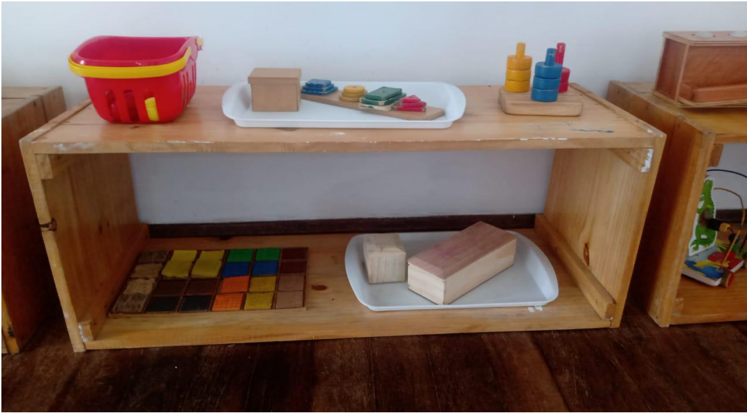
Figura II – Prateleiras adaptadas ao tamanho infantil com materiais disponíveis