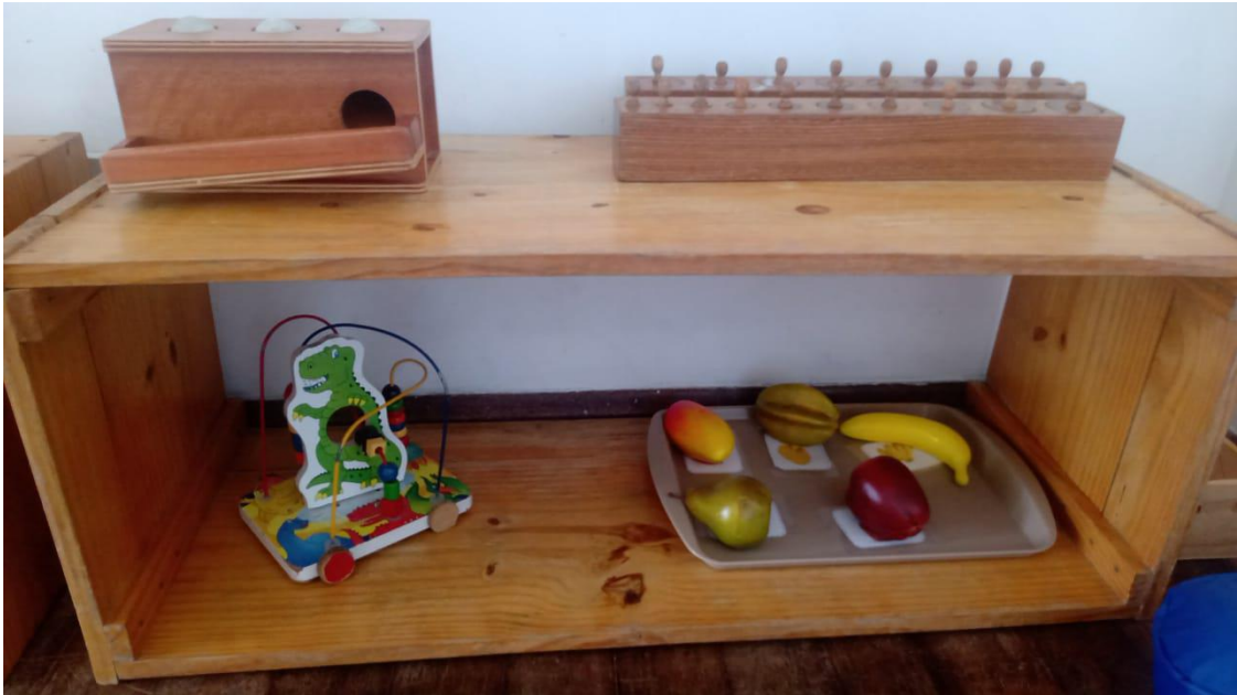
Figura IV – Prateleiras adaptadas ao tamanho infantil com materiais disponíveis