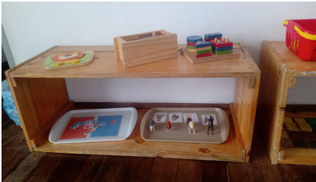
Figura III – Prateleiras adaptadas ao tamanho infantil com materiais disponíveis