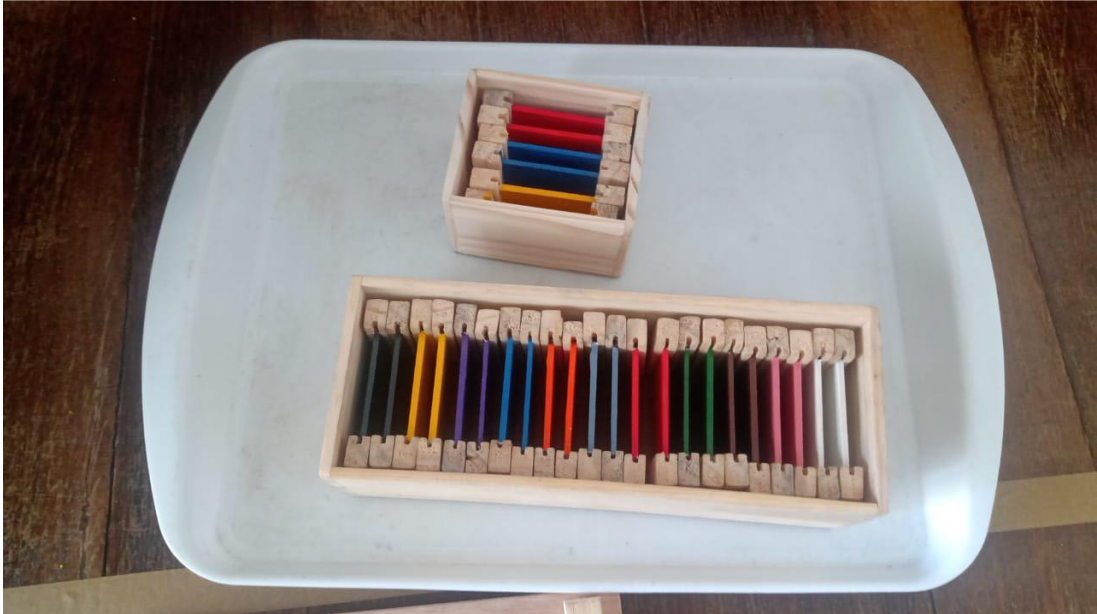
Figura VI – Caixa de cores