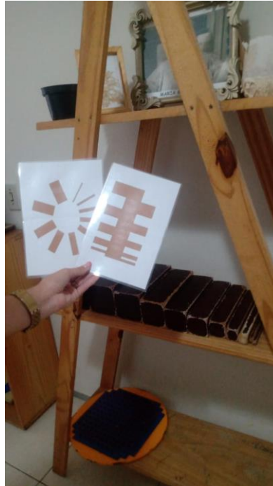
Figura XIV – Escada marrom

Como exemplificado na imagem, com este material as crianças trabalharão o reconhecimento numérico e a escrita do mesmo, além do contato com texturas diferentes, sendo assim um material sensorial. Primeiro contornarão o número de lixa com o dedo e depois será feito o mesmo na caixa de areia.