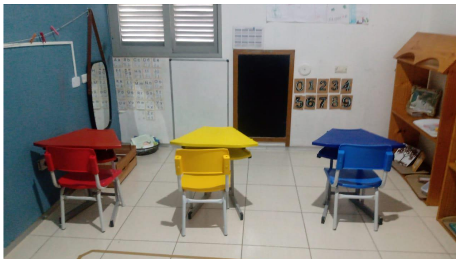
Figura IX – Sala de aula G2