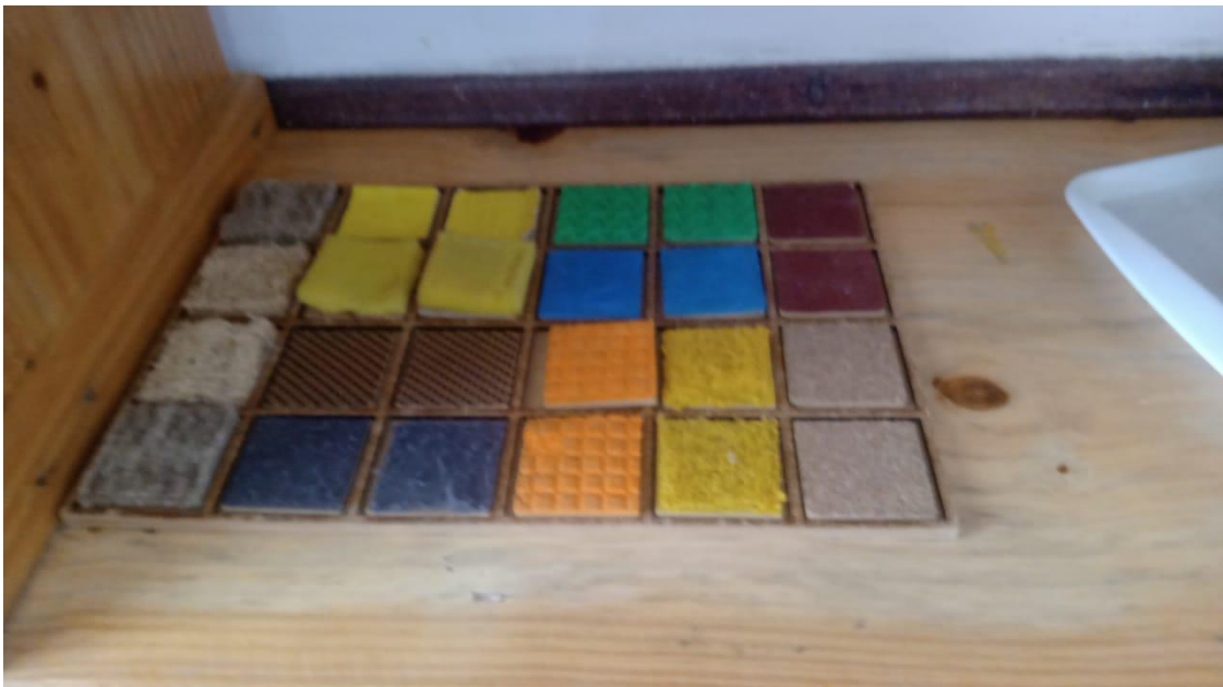
Figura V – Material sensorial: Texturas

Nas prateleiras acima vemos a presença de alguns materiais montessorianos, assim como bandejas com atividades, a exemplos os encaixes sólidos de madeira, caixa de cores, associação de figuras e material sensorial com diversas texturas diferentes.