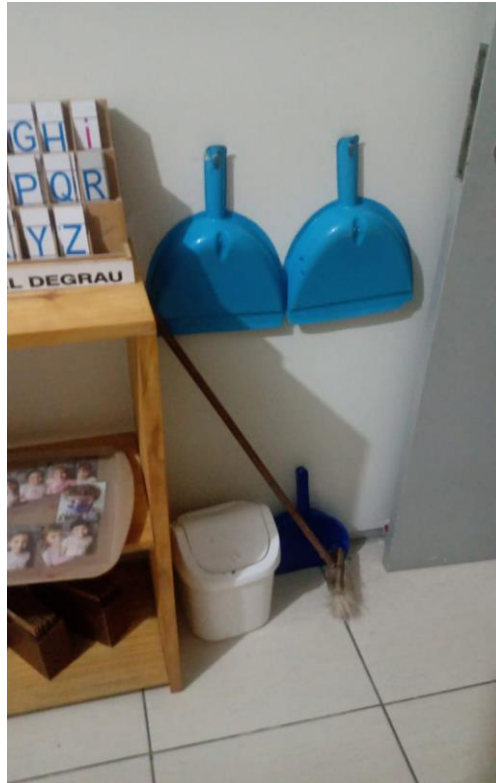
Figura XII – Materiais para vida prática

Outro ponto observado não só na estante acima como também em muitos espaços da escola, são os materiais para limpeza do ambiente, todos adaptados para o uso das próprias crianças, exercitando a vida prática, o cuidado com o ambiente e o próprio movimento motor.