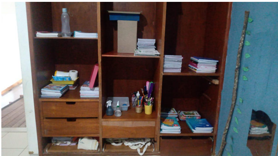
Figura XI – Estante de materiais para livre uso