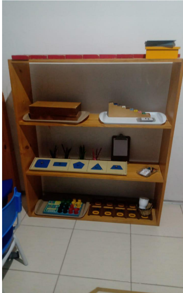
Figura X – Prateleira de atividades