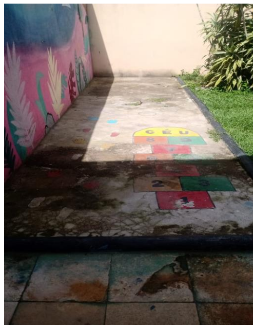
Figura XVI – Espaço da psicomotricidade

Além do espaço verde, o espaço externo também contempla ambientes para o desenvolvimento da psicomotricidade, área para oficinas de artes – realizadas no segundo horário do período integral – cozinha para o preparo de receitas, piscina e parquinho.