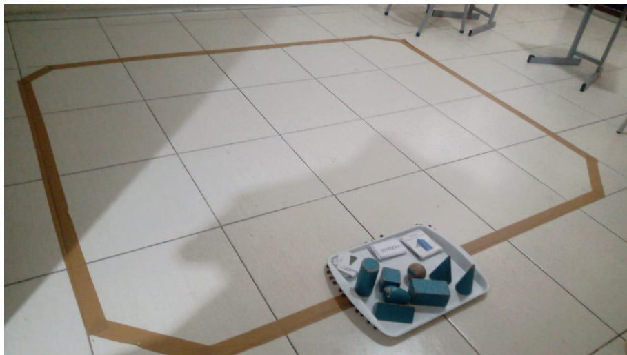
Figura VIII - Representação de como se organiza a atividade nas linhas para trabalho

Os espaços do G2 atendem às crianças de 4 a 6 anos de idade. Essas apresentam um ambiente já adaptado para receber crianças mais velhas, porém são salas igualmente amplas com a presença de somente 3 carteiras, com lousa e quadro para utilização da própria criança que já começa a despertar interesse pela escrita e matemática, além de materiais também disponíveis para o uso independente do aluno. Igualmente as salas do G1, também se faz presente as linhas no chão com a mesma finalidade.