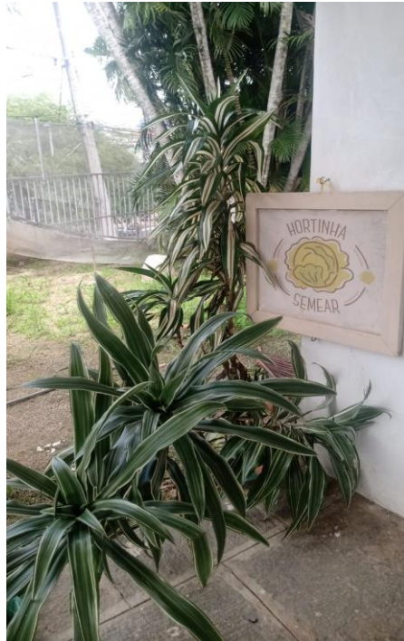
Figura XV – Horta presente no espaço externo