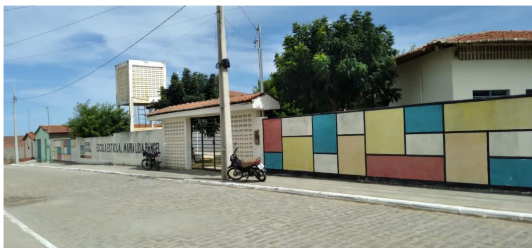
Figura 2- Escola Estadual Maria Lídia Rangel, Tenório – PB.

A Escola Estadual Maria Lídia Rangel está situada no município de Tenório – PB, inserida na Meso-região da Borborema e na Micro-região do Seridó Oriental Paraibano, está localizada na Rua Anativa Mota de Azevedo e oferece o Ensino Médio na modalidade Regular e na Educação de Jovens e Adultos – EJA.