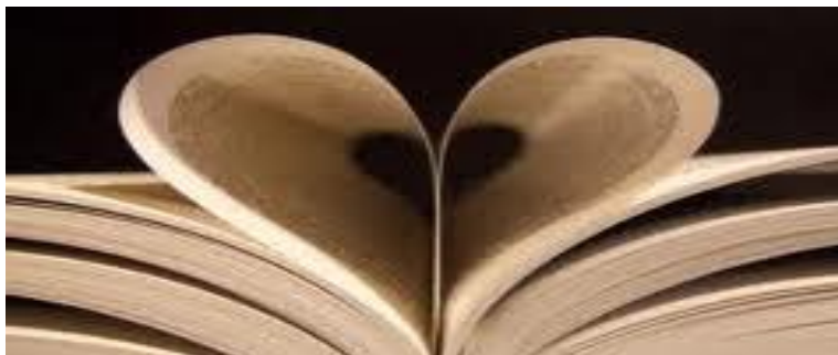
O livro é uma extensão da memória e da imaginação." (Jorge Luis Borges)

O Livro Didático selecionado para essa análise se intitula Projeto Araribá – Geografia 7º ano do Ensino Fundamental da editora Moderna 2007 (2ª edição). Este livro traz um enfoque sobre o Território Brasileiro elencando seus aspectos físicos, econômicos, sociais e culturais. No interior dos capítulos e unidades, são ilustrações de fotografias, mapas ou imagens são utilizados para contextualizar a temática que será trabalhada, como também são empregados quadros contendo explicações referentes aos conteúdos e boxes com vocabulário de alguns termos geográficos. No término de cada capítulo, são sugeridas atividades (ver em anexo) as quais favorecem a revisão dos conteúdos trabalhados extra sala de aula para os alunos.