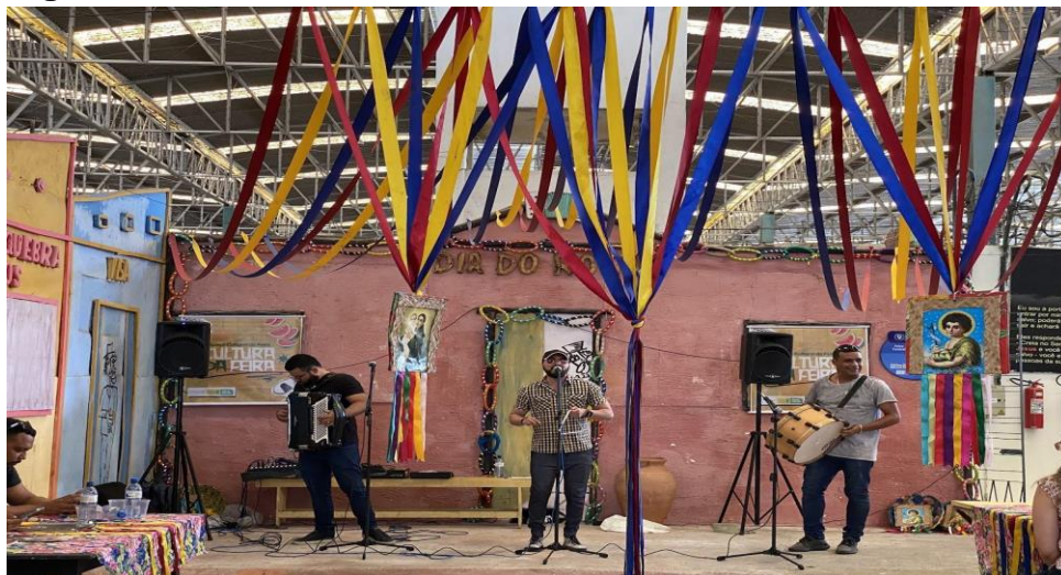
Figura 1: Matéria “Bom é na Feira”.

na Feira central da cidade, com o objetivo de fortalecer e propagar a cultura e o comércio local (Figura 1).