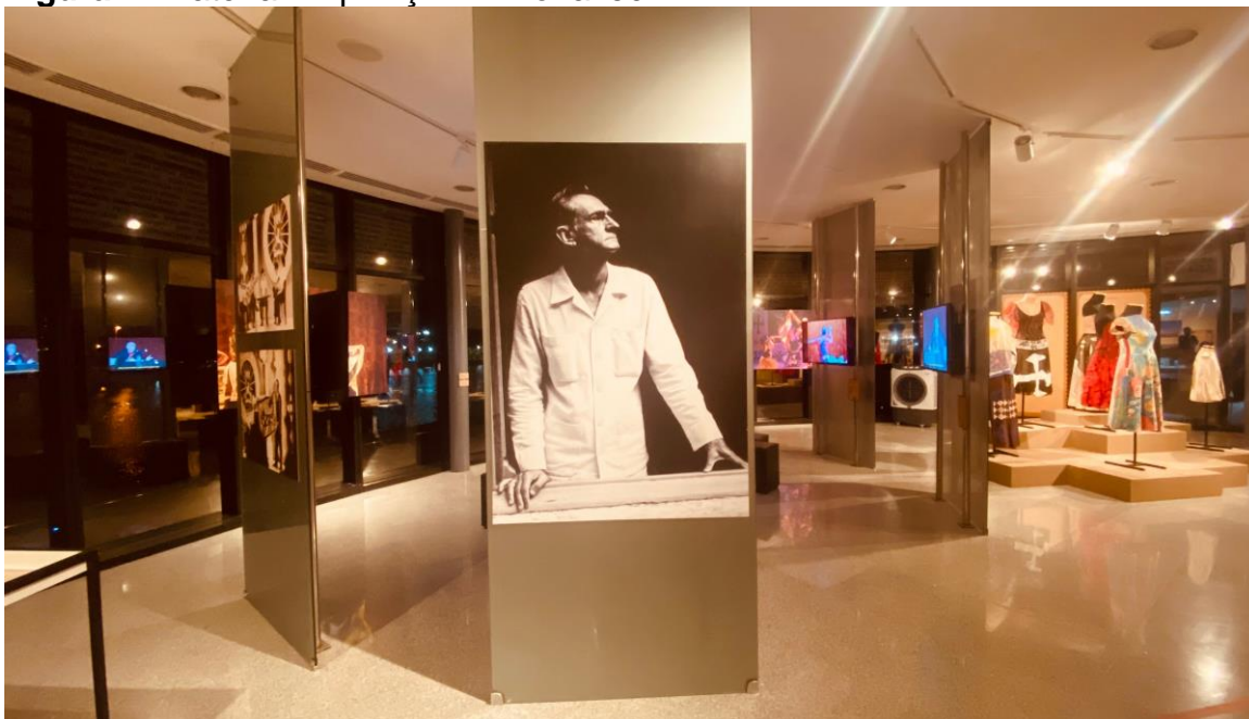
Figura 7: Matéria “Exposição Armorial 50”.

A sétima matéria do blog fala sobre exposição no Museu de Arte Popular da Paraíba (MAPP) (LUCENA, 2023a), em celebração ao Movimento Armorial, de Ariano Suassuna (Figura 7).