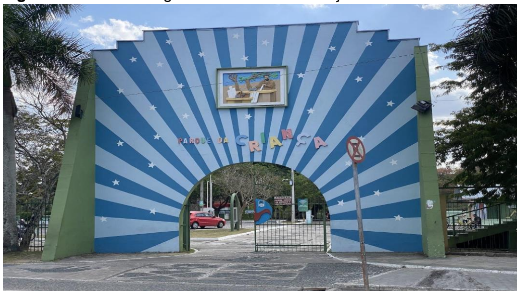
Figura 4: Matéria “Programa do Dia das Crianças”.

A quarta matéria “Dia das crianças em Campina Grande” (LUCENA, 2022d), informa sobre a programação do Parque da Criança no feriado (Figura 4).