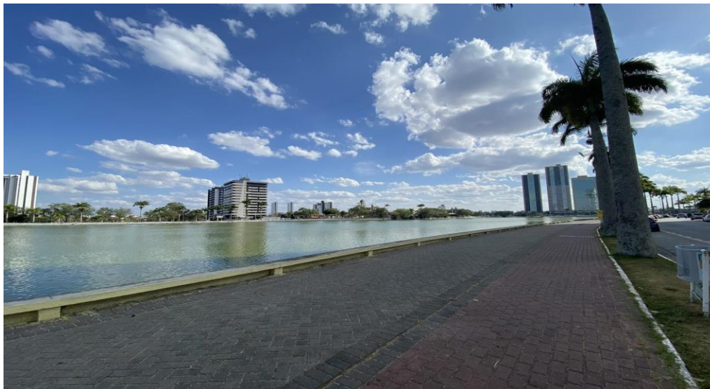
Figura 3: Matéria “Aniversário de Campina Grande”.

A terceira postagem “Aniversário de Campina Grande” (LUCENA, 2022c), descreve sobre a programação nos pontos turísticos da cidade no dia do seu aniversário (Figura 3).