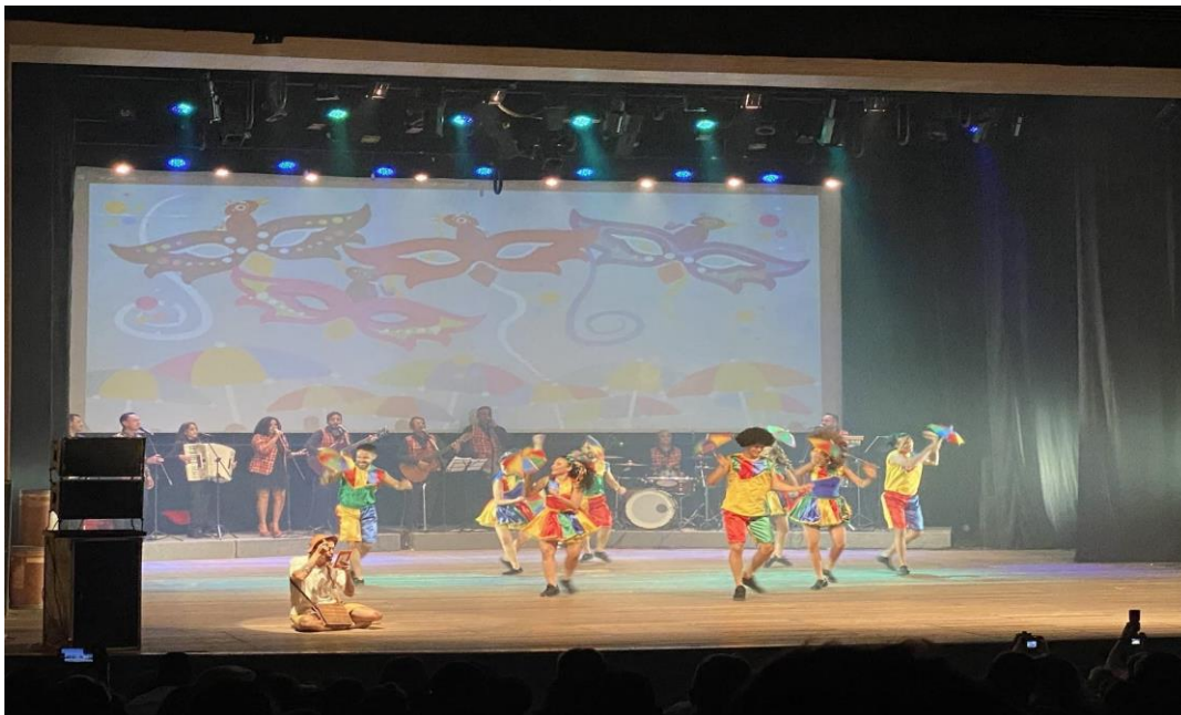
Figura 5: Matéria “Espetáculo do grupo Tropeiros da Borborema”.

A quinta matéria “Grupo Tropeiros Comemora Aniversário” (LUCENA, 2022e), informa sobre o aniversário de 40 anos do grupo de dança regional Tropeiros da Borborema (Figura 5).