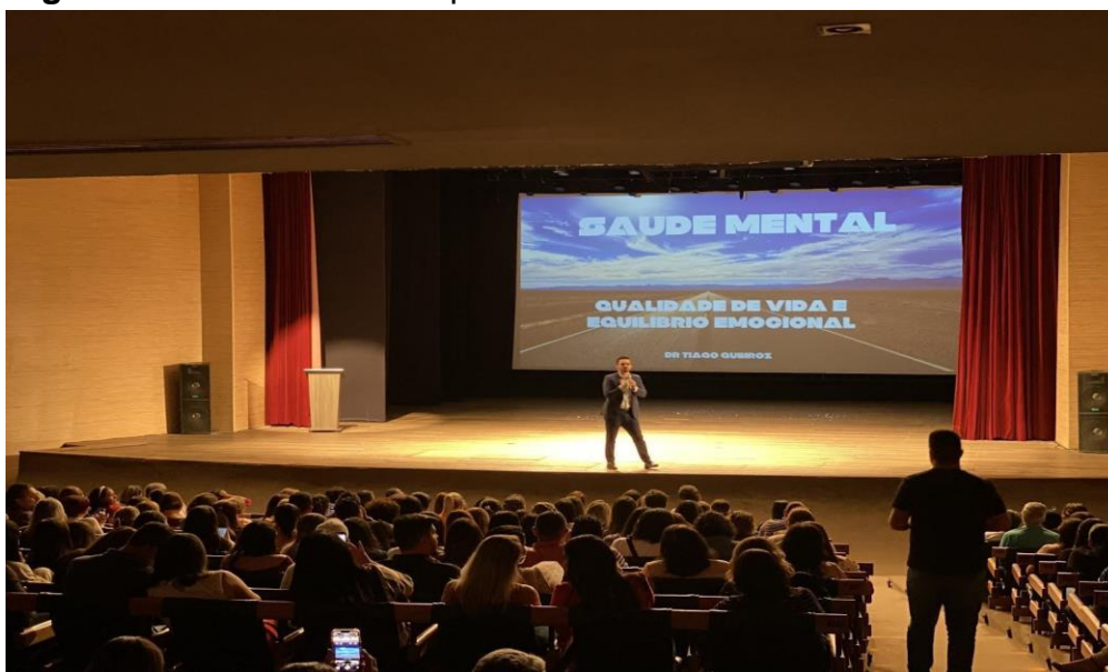
Figura 2: Matéria “Workshop Florescer da Vida”.

A segunda matéria fala sobre o Workshop “Florescer da Vida” ministrado pelo psiquiatra Dr. Thiago Queiroz no Teatro Municipal Severino Cabral (LUCENA, 2022b), alerta e enfatiza a importância do autocuidado e do acompanhamento psicológico periódico para a sociedade na atualidade (Figura 2).