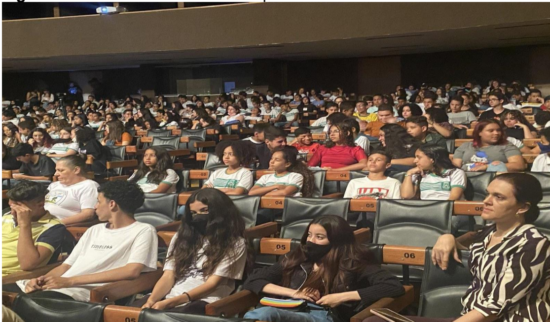
Figura 6: Matéria “Cinema Viva Campina”.