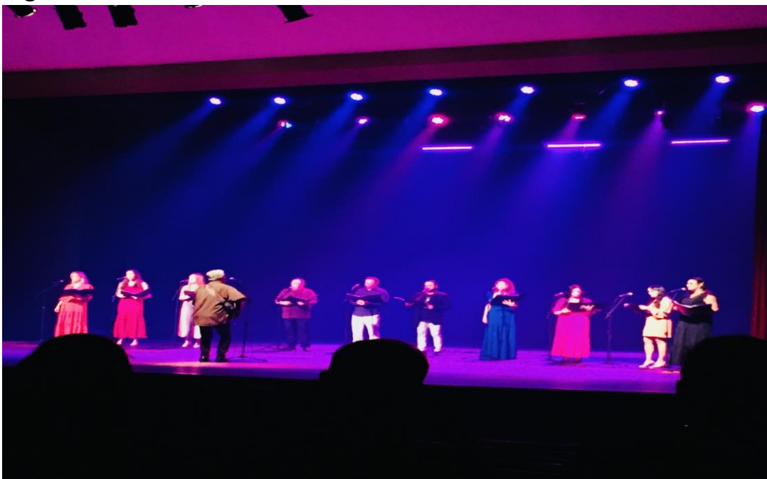
Figura 8: Matéria “Festival de Cultura Católica”.

A oitava matéria do blog “Festival de Cultura Católica” (LUCENA, 2023b), informa sobre a programação do evento de comemoração em alusão aos 75 anos da Diocese de Campina Grande (Figura 8).