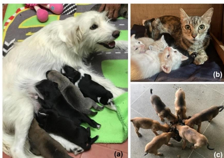
Figura 7 – Alguns animais resgatados e mantidos sob cuidados do Projeto Bazar de Livros