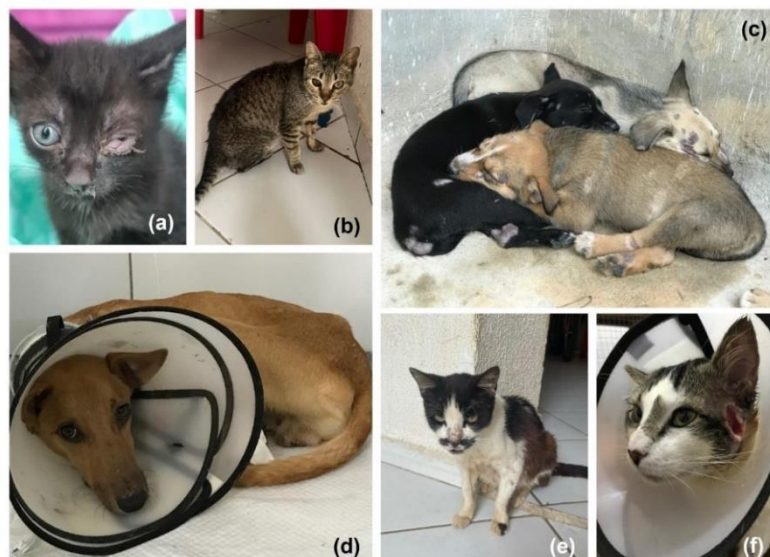
Figura 5 – Alguns animais tratados no período avaliado