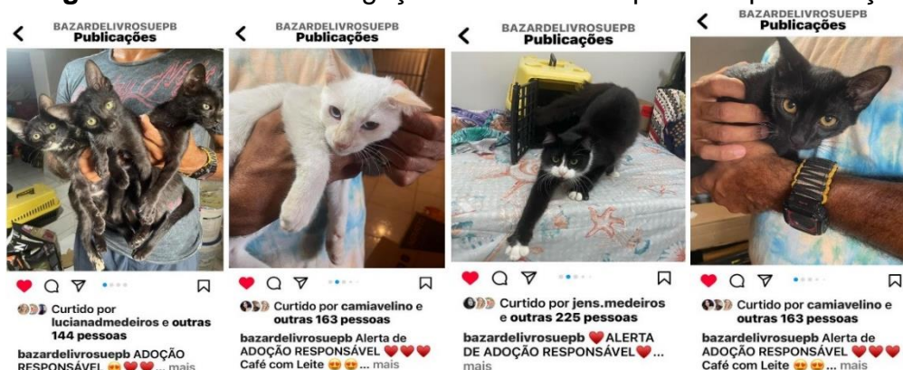
Figura 8 – Posts de divulgação de animais disponíveis para adoção