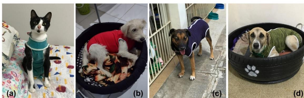
Figura 6 – Alguns animais castrados e mantidos sob cuidados pós-operatórios do Projeto Bazar de Livros