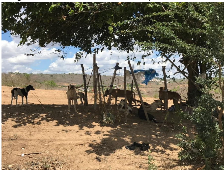
Figura 3 – Cães instalados em terreno pertencente a UEPB