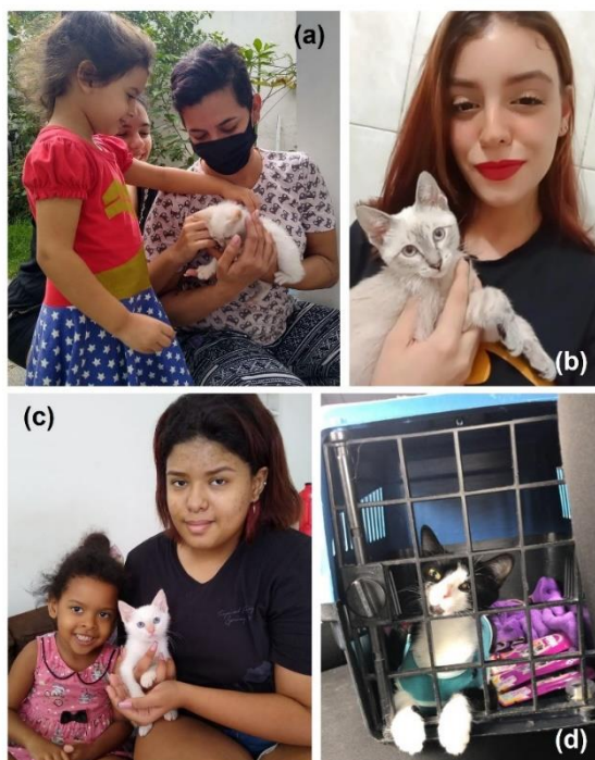
Figura 9 – Alguns animais adotados