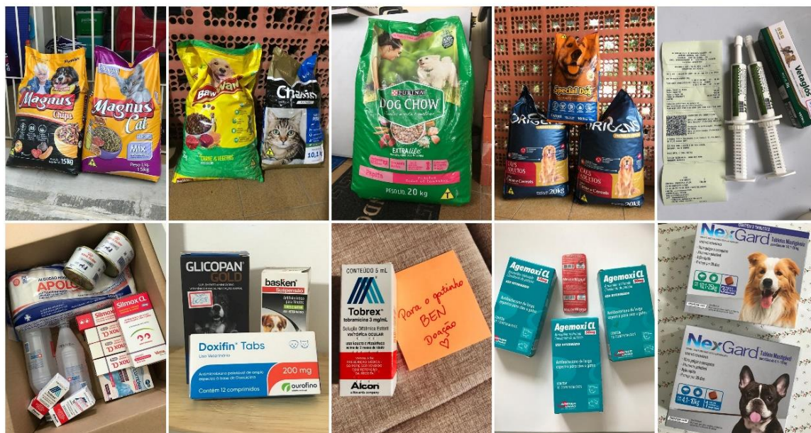
Figura 10 – Alguns itens doados pelo Projeto Bazar de Livros a ONGs e grupos protetores de animais