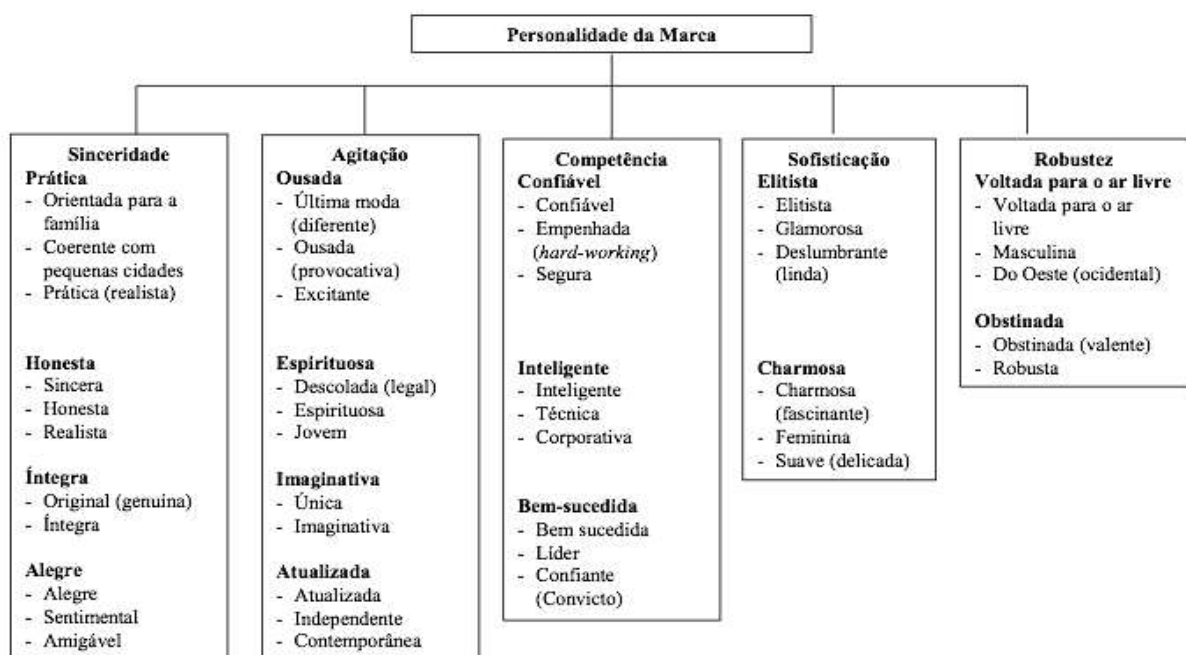
Figura 1 - Escala de Personalidade da Marca

Fonte: Aaker (1997), adaptado por Muniz e Marchetti (2005)